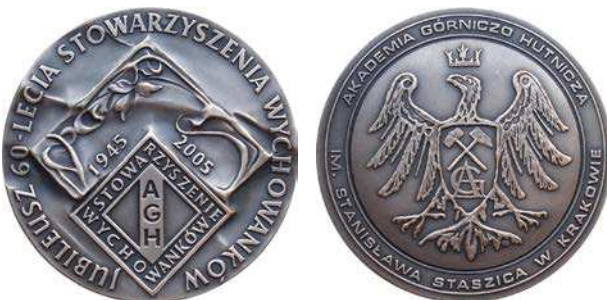
Medal 60-lecia Stowarzyszenia Wychowanków Akademii Górniczo-Hutniczej w Krakowie z 2005 roku, tombak srebrzony i oksydowany