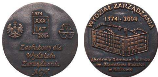
Medal Zasłużony dla Wydziału Zarządzania z 2004 roku

Z okazji XII Festiwalu Nauki w Krakowie 12 maja 2012 roku na stoisku Wydziału Metali Nieżelaznych Akademii Górniczo-Hutniczej, umieszczonym na Rynku Głównym w Krakowie były wybierane na prasie pamiątkowe żetony z aluminium. Na awersie żetonu napis: FESTIWAL / NAUKI / w Krakowie / 2012. W otoku: Akademia Górniczo-Hutnicza im. St. Staszica. Na rewersie logo wydziału. Przy krawędzi napis: Wydział Metali Nieżelaznych, u dołu: AGH. Średnica 22 mm.