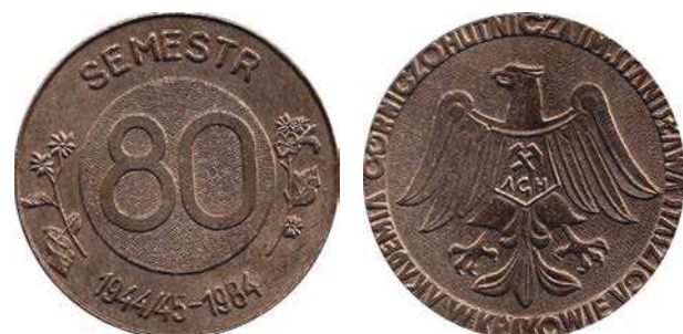
Medal 80 semestru Akademii Górniczo-Hutniczej w Krakowie z 1984 roku