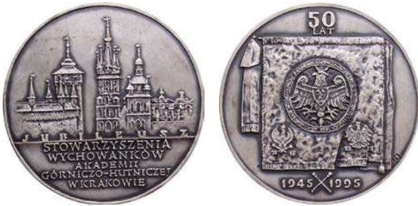
Medal 50-lecia Stowarzyszenia Wychowanków Akademii Górniczo-Hutniczej w Krakowie z 1995 roku