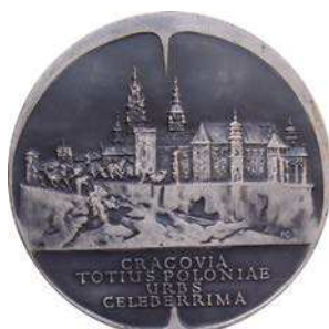
Medal 70-lecia Akademii Górniczo-Hutniczej w Krakowie