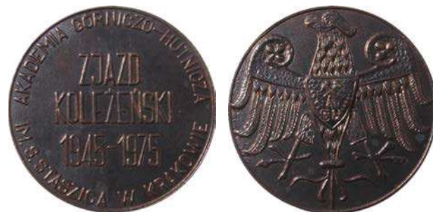
Medal zjazdu koleżeńskiego z 1975 roku

Bieg AGH jest cykliczną imprezą organizowaną od 2012 roku. Jego celem jest propagowanie zdrowego stylu życia oraz integracja