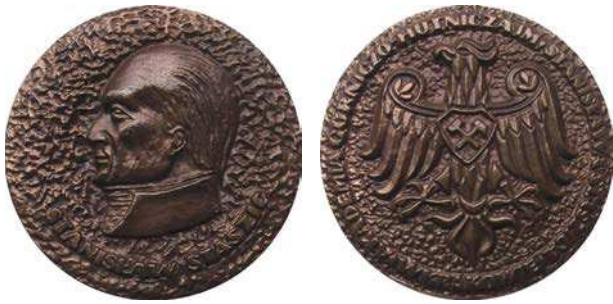
Medal AGH ze Stanisławem Staszicem

cja związkowa w ramach ZNP została powołana na Akademii Górniczej w 1945 roku. W początkowym okresie działalności jej głównym celem było zaopatrywanie pracowników w żywność i odzież w trudnym okresie bezpośrednio po zakończeniu wojny.