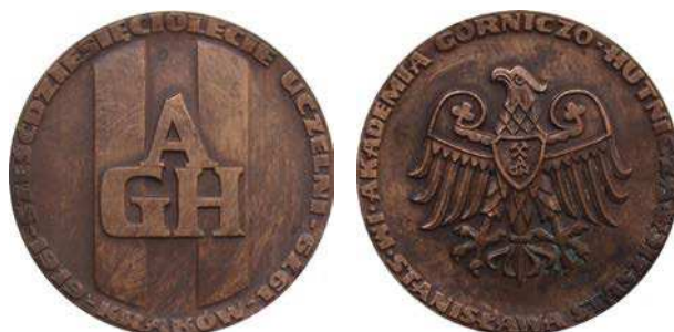
Medal 60-lecia Akademii Górniczo-Hutniczej w Krakowie, tombak patynowany