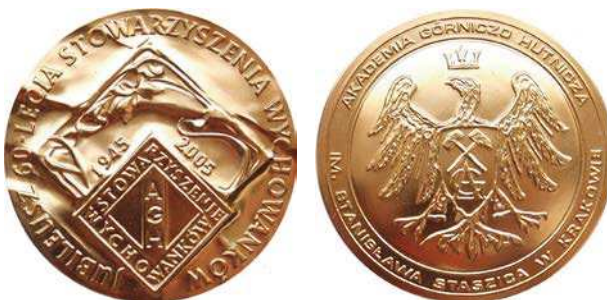
Medal 60-lecia Stowarzyszenia Wychowanków Akademii Górniczo-Hutniczej w Krakowie z 2005 roku, tombak złocony