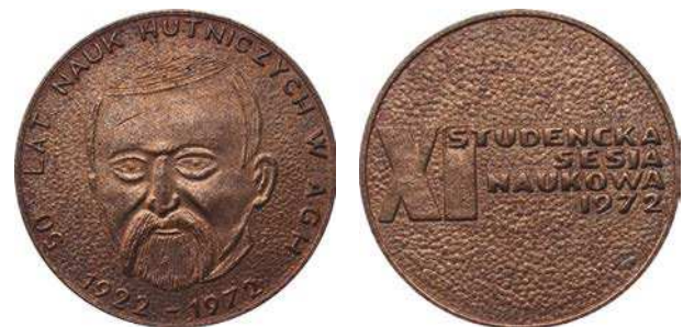
Medal z okazji XI Studenckiej Sesji Naukowej z 1972 roku