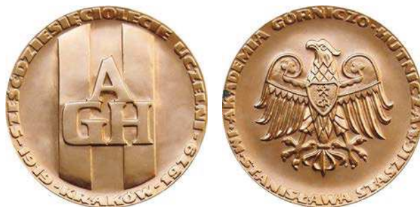
Medal 60-lecia Akademii Górniczo-Hutniczej w Krakowie, tombak złoczony