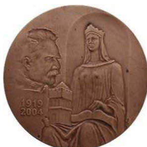
Medal 85-lecia Akademii Górniczo-Hutniczej w Krakowie, tombak patynowany