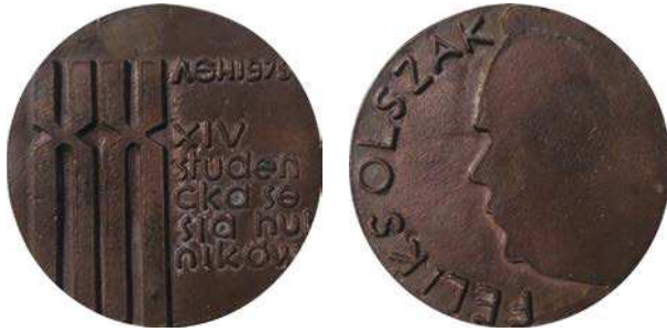
Medal z okazji XIV Studenckiej Sesji Hutników z 1975 roku

Rodziewicz-Bielewicz). W otoku napis: 50 LAT NAUK HUTNICZYCH W AGH / 1922 – 1972. Na rewersie na fakturowanym tle napis: XI / STUDENCKA / SESJA / NAUKOWA / 1972. Średnica 60 mm.