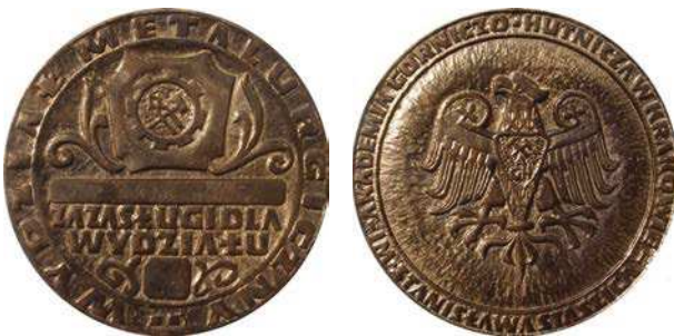
Medal za zasługi dla Wydziału Metalurgicznego

Kolejny medal przyznawany był za zasługi dla Wydziału Metalurgicznego. W górnej części awersu na tarczy umieszczono symbol hutnictwa w postaci skrzyżowanego młotka i kleszczy w kole zębata, po obu stronach ornamenty. W dolnej części napis: ZA ZASŁUGI DLA / WYDZIAŁU, poniżej figura geometryczna, po bokach ornamenty. W otoku napis: WYDZIAŁ METALURGICZNY. Na rewersie godło uczelni, w otoku napis: AKADEMIA GÓRNICZO-HUTNICZA W KRAKOWIE / IM. STANISŁAWA STASZICA. Średnica 94 mm.