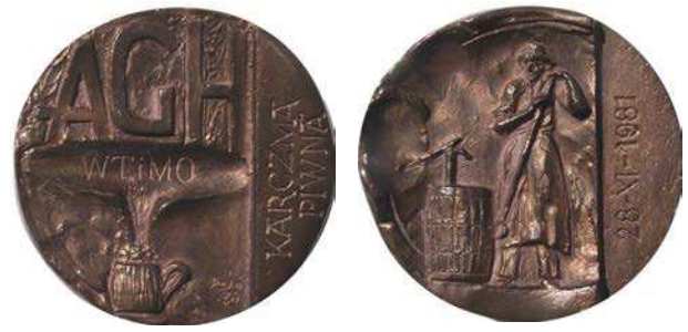
Medal karczmny piwnej z 1981 roku