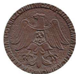
Medal 25-tej rocznicy rozpoczęcia studiów na Wydziale Górniczym z 1978 roku