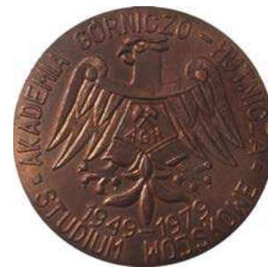
Medal Studium Wojskowego AGH z 1979 roku