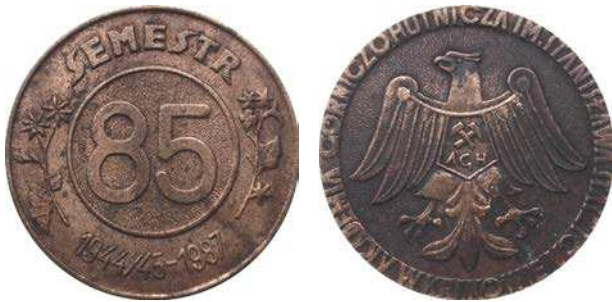
Medal 85 semestru Akademii Górniczo-Hutniczej w Krakowie z 1987 roku