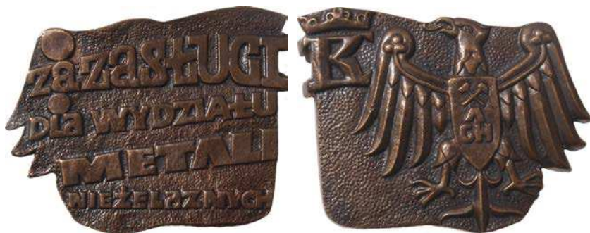
Medal za zasługi dla Wydziału Metali Nieżelaznych

Zakład Doświadczalny Aparatury Naukowej działał przy AGH w Krakowie od 1957 roku. W wyniku reformy, na początku lat 90-tych zakład został wyprowadzony poza ramy organizacyjne uczelni.