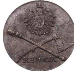
Medal rektorski Akademii Górniczo-Hutniczej ze skrzyżowanym berłem i górniczym toporem ceremonialnym na awersie