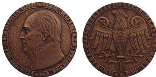
Medal 50-lecia Akademii Górniczo-Hutniczej w Krakowie, tombak patynowany

W 1947 roku podjęto wewnętrzną uchwałę o zmianie nazwy na Akademię Górniczo-Hutniczą, zatwierdzoną przez władze w Warszawie dwa lata później. W 1969 roku, z okazji jubileuszu 50-lecia uczelni, Akademii Górniczo-Hutniczej nadano imię Stanisława Staszica.