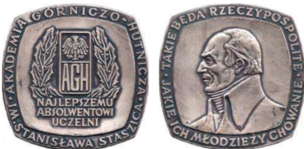
Medal dla najlepszego absolwenta uczelni w wersji z 1980 roku