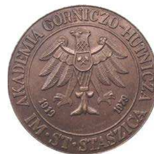
Medal Rady Zakładowej ZNP w AGH z 1979 roku