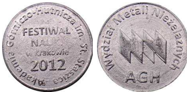
Żeton Wydziału Metali Nieżelaznych z Festiwalu Nauki w Krakowie z 2012 roku