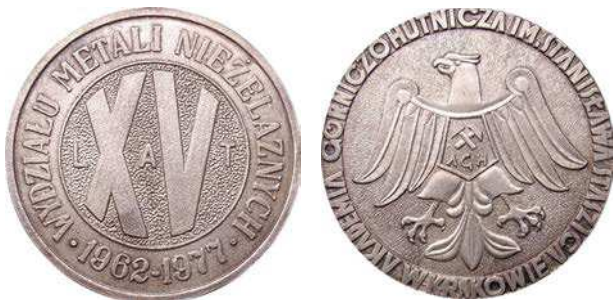
Medal 15-lecia Wydziału Metali Nieżelaznych z 1977 roku, wersja z białego metalu