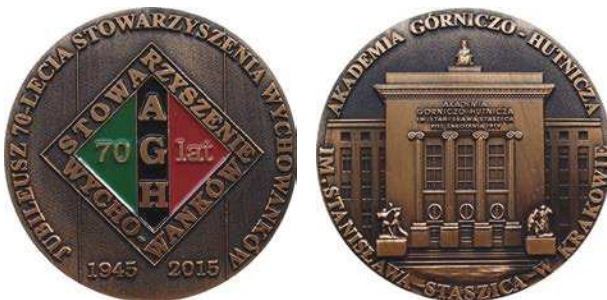
Medal 70-lecia Stowarzyszenia Wychowanków Akademii Górniczo-Hutniczej w Krakowie z 2015 roku

STOWARZYSZENIA / WYCHOWANKÓW / AKADEMII / GÓRNICZO-HUTNICZEJ / W KRAKOWIE. Na rewersie sztandar ufundowany z okazji 40-lecia Stowarzyszenia Wychowanków AGH w 1985 roku, powyżej napis: 50 / LAT, poniżej 1945 / 1995, między nimi dwa skrzyżowane berła rektorskie. Medal sygnowany na rewersie monogramem NJ, zaprojektował i wykonał Jerzy Nowakowski. Średnica wynosi 70 mm. W nakładzie 200 sztuk wybiła Mennica Państwowa.