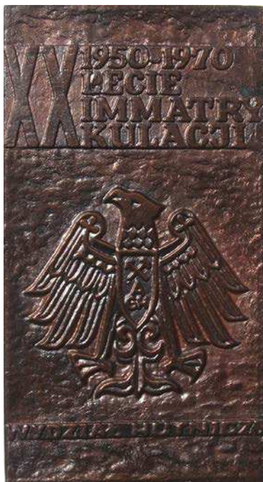
Plakietka 20-lecia immatrykulacji na Wydziale Hutniczym z 1970 roku

W 1970 roku z okazji 20-lecia immatrykulacji na Wydziale Hutniczym została wykonana jednostronna plakietka przedstawiająca herb AGH. Powyżej napis: XX / 1950–1970 / LECIE / IMMATRY / KULACJI. Poniżej: WYDZIAŁ HUTNICZY. Wymiary 68 × 123 mm.