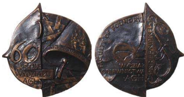
Medal 60-lecia Wydziału Odlewnictwa AGH