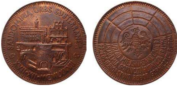
Medal z uruchomienia Podziemnej Trasy Turystycznej w Sandomierzu z 1977 roku

ne młotki górnicze, tak zwane kupła: pyrylik i żelazko, stanowiące symbol górnictwa. Na rewersie godło uczelni, w otoku napis: AKADEMIA GÓRNICZO HUTNICZA IM. STANISŁAWA STASZICA / W KRAKOWIE.