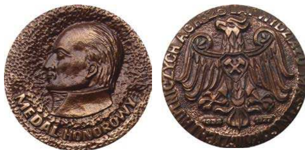
Medal honorowy Wydziału Maszyn Górniczych i Hutniczych z 1977 roku

Wspomniany wcześniej Wydział Mechanizacji Górnictwa i Hutnictwa, który powstał w 1952 roku po podziale Wydziału Elektromechanicznego, w 1957 roku zmienił nazwę na Wydział Maszyn Górniczych i Hutniczych. Pod taką nazwą działał do 1992 roku, kiedy to zmieniono nazwę na Wydział Inżynierii Mechanicznej i Robotyki.