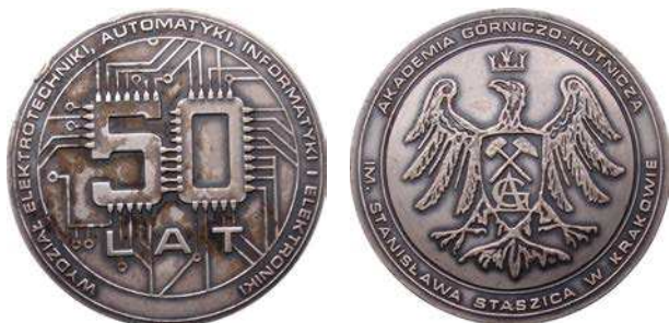
Medal 50-lecia Wydziału Elektrotechniki, Automatyki, Informatyki i Elektroniki z 2002 roku

Również 60-lecie Wydziału Odlewnictwa zostało upamiętnione emisją medalu. Medal o nieregularnym kształcie. Awers podzielony na dwie części. Na lewej napis: 60 / LECIE / WYDZIAŁU / AGH. Na prawej dzwon z rysunkiem zabudowań sakralnych i napisem ODLEWNICTWA. Na rewersie z lewej strony logo wydziału, poniżej napis: WYDZIAŁ / ODLEWNICTWA / AGH. Z lewej strony przy krawędzi: FACULTY OF FOUNDRY. Po prawej stronie dekoracyjny or-