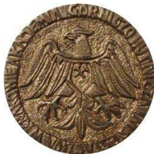
Medal 20-lecia Zakładu Doświadczalnego Aparatury Naukowej AGH z 1977 roku

Z 1977 roku pochodzi medal wykonany z okazji 20-lecia Zakładu Doświadczalnego Aparatury Naukowej. Na awersie napis: ZAKŁAD DOŚWIADCZALNY / APARATURY NAUKOWEJ, powyżej 1957, poniżej 1977. Na rewersie godło uczelni, w otoku napis: AKADEMIA GÓRNICZO HUTNICZA IM. ST. STASZICA W KRAKOWIE. Średnica medalu 89 mm.