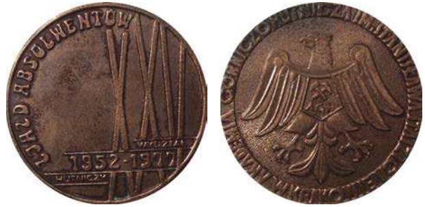
Medal z okazji Zjazdu Absolwentów na 25-lecie Wydziału Hutniczego z 1977 roku