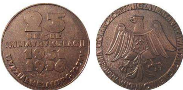
Medal Wydziału Metalurgicznego z okazji 25-lecia immatrykulacji z 1976 roku