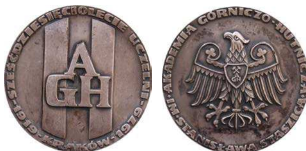
Medal 60-lecia Akademii Górniczo-Hutniczej w Krakowie, tombak srebrzony i oksydowany