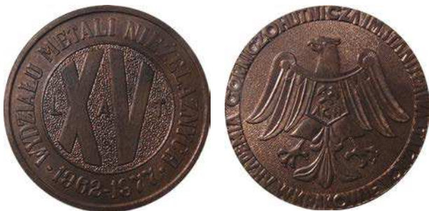
Medal 15-lecia Wydziału Metali Nieżelaznych z 1977 roku, wersja z brązu