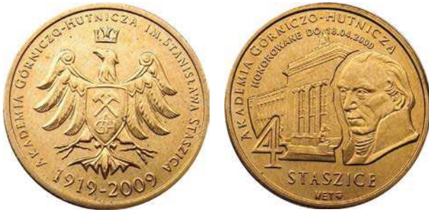
Dukat lokalny 4 Staszice