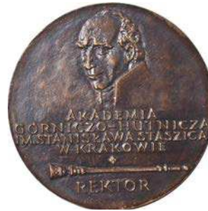
Medal rektorski Akademii Górniczo-Hutniczej z 1983 roku