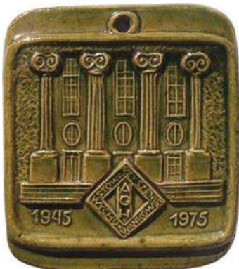
Plakietka ceramiczna 30-lecia Stowarzyszenia Wychowanków AGH w Krakowie z 1975 roku

-Hutniczej. Celem Stowarzyszenia jest między innymi jednocześnie wychowanków AGH w Krakowie dla utrzymania współżycia kulturalno-towarzystwicznego oraz utrzymywania łączności z uczelnią i jej władzami w pielęgnowaniu tradycji górniczo-hutniczych, zawodowych i uczelnianych oraz rozwoju uczelni. Od 1975 roku przyjęto zwyczaj, by za początek stowarzyszenia uważać 1945 rok i od tej daty liczyć kolejne jubileusze. Od tego czasu okrągłe jubileusze upamiętniane są też pamiątkowymi medalami.