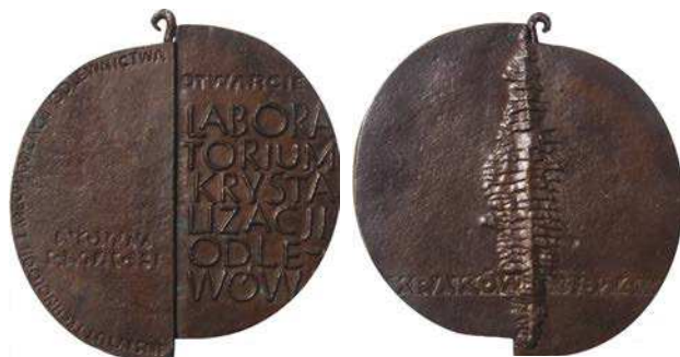
Medal z okazji otwarcia Laboratorium Krystalizacji Odlewów z 1974 roku