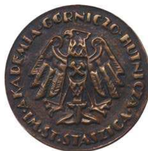
Medal za zasługi obronne i obrony cywilnej w AGH