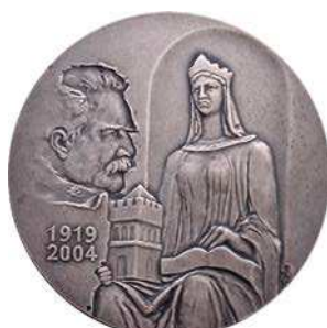
Medal 85-lecia Akademii Górniczo-Hutniczej w Krakowie, tombak srebrzony i oksydowany