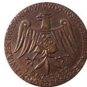
Medal Koła ZBoWiD przy AGH z 1977 roku

W 1990 roku ZBoWiD przekształcono w Związek Kombatanatów Rzeczypospolitej Polskiej i Byłych Więźniów Politycznych.