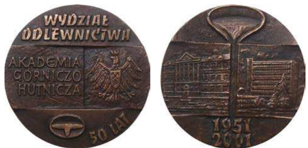
Medal 50-lecia Wydziału Odlewnictwa AGH z 2001 roku

Medale przypominają nie tylko oficjalne uroczystości i jubileusze, ale również wydarzenia mniej formalne. Przykładem jest karczma piwna, której spotkanie odbyło się 28 listopada 1981 roku. Spotkanie gwarków, czyli karczma piwna jest tradycyjną zabawą, odbywającą się według stałego rytuału w sezonie barbórkowym. Na awersie medalu przedstawiono kadz z wylewającym się do kufła płynem. Powyżej litery AGH. Na tle kadzi skrót WTIMO (Wydział Technologii i Mechanizacji Odlewnictwa). Na oddzielnym polu z prawej strony pionowo napis: KARCZMA / PIWNA. U dołu sygnatura autora. Na rewersie został umieszczony mężczyzna w stroju hutniczym przy pracy, trzymający narzędzie hutnicze zakończone czerpakiem. Na polu z prawej strony pionowo data: 28-XI-1981. Średnica medalu 78 mm, grubość 9 mm.