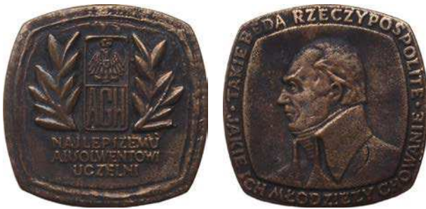
Medal dla najlepszego absolwenta uczelni

Drugi dukat wyemitowany został 28 maja 2009 roku. Na awersie umieszczono godło Akademii Górniczej, w otoku napis: AKADEMIA GÓRNICZO-HUTNICZA IM. STANISŁAWA STASZICA, u dołu daty: