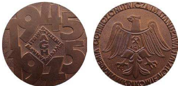
Medal 30-lecia Stowarzyszenia Wychowanków Akademii Górniczo-Hutniczej w Krakowie z 1975 roku

Działalność organizacyjna absolwentów Akademii Górniczej w Krakowie sięga 1923 roku. Na spotkaniu w grudniu 1945 roku zdecydowano o utworzeniu Stowarzyszenia Wychowanków Akademii Górniczej. Statut stowarzyszenia został zarejestrowany w 1948 roku, co pozwoliło na formalne rozpoczęcie działalności. W 1949 roku zmieniono nazwę na Stowarzyszenia Wychowanków Akademii Górniczo-