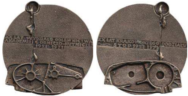
Medal 20-lecia Wydziału Odlewnictwa z 1971 roku