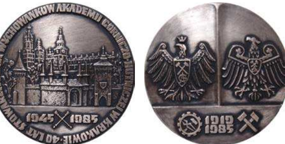
Medal 40-lecia Stowarzyszenia Wychowanków Akademii Górniczo-Hutniczej w Krakowie z 1985 roku, tombak srebrzony i oksydowany

W 1975 roku został wydany medal 30-lecia Stowarzyszenia Wychowanków Akademii Górniczo-Hutniczej w Krakowie