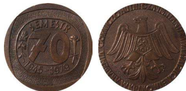
Medal 70 semestru Akademii Górniczo-Hutniczej w Krakowie z 1979 roku