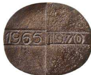
Medal Punktu Konsultacyjnego AGH przy OFNE w Olkuszu z 1970 roku

Kolejny medal był przyznawany za zasługi obronne i obrony cywilnej w AGH. Na awersie znajduje się napis: ZA ZASŁUGI / OBRONNE / I OBRONY / CYWILNEJ / W AGH. Z prawej strony lewy profil głowy w hełmie. Przy krawędzi dwie gałązki. Na rewersie godło uczelni, w otoku napis: AKADEMIA GÓRNICZO-HUTNICZA / IM. ST. STASZICA. Średnica 83 mm.