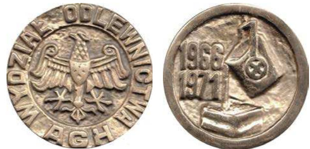
Medal Wydziału Odlewnictwa AGH z 1971 roku