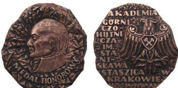
Medal honorowy AGH

1919–2009. Na rewersie, na tle głównego gmachu uczelni znajduje się pomnik górników. U góry półkolem napis: AKADEMIA GÓRNICZO-HUTNICZA / honorowany do 30.09.2009. Z prawej strony: 7, u dołu: STASZICÓW, z lewej: MET i znak menniczy. Wybito dwie wersje w Mennicy Polskiej. Pierwsza bimetalowa, pierścien – mosiądz, rdzeń – miedzionikiel, średnica 27 mm, nakład 30.000 sztuk. Druga w srebrze Ag500, średnica 32 mm, nakład 1000 sztuk. Autorem projektu jest również Witold Nazarkiewicz.