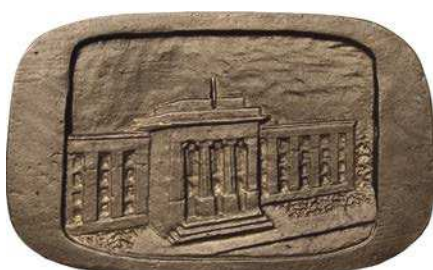
Medal Wydziału Elektrotechniki AGH z 1973 roku

Następny medal został wyemitowany w 2001 roku z okazji 50-lecia Wydziału Odlewnictwa. Awers podzielony na cztery pola, w górnym napis: WYDZIAŁ / ODLEWNICTWA, w lewym: AKADEMIA / GÓRNICZO / HUTNICZA, w prawym godło uczelni, w dolnym stary symbol wydziału, a przy krawędzi po prawej stronie napis 50 LAT. Rewers przedzielony na dwie części rysunkiem cieszki wypływającej z kadzi. Z lewej strony budynek Akademii Górniczej przy ul. Krzemionki 11 w Krakowie, w którym w okresie wojny mieściła się Państwowa Szkoła Techniczna Górniczo-Hutniczo-Miernicza. Z prawej strony budynek przy ul. Reymonta 23, gdzie obecnie mieści się siedziba Wydziału Odlewnictwa. U dołu daty: 1951 / 2001. Średnica medalu wynosi 80 mm.