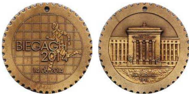
Medal Biegu AGH z 2014 roku

środowiska AGH, studentów i dydaktyków, mieszkańców Krakowa i fanów sportów biegowych. Po przekroczeniu mety zawodnicy otrzymują pamiątkowe medale, różne w kolejnych latach.