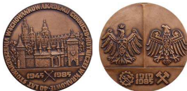
Medal 40-lecia Stowarzyszenia Wychowanków Akademii Górniczo-Hutniczej w Krakowie z 1985 roku, tombak patynowany

w do następnej linii. W środkowej części rewersu znajduje się godło Stowarzyszenia: równoboczny skośny czworobok z umieszczonymi pionowo literami AGH, wokół czworoboku otoczek z napisem: Stowarzyszenie Wychowanków. Powyżej godła rok 1945, poniżej 1975. Na rewersie umieszczono godło uczelni, w otoku napis: AKADEMIA GÓRNICZO-HUTNICZA IM. STANISŁAWA STASZICA / W KRAKOWIE. Średnica medalu wynosi 60 mm.