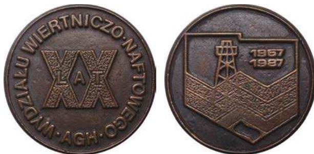
Medal 20-lecia Wydziału Wiertniczo-Naftowego z 1987 roku

fakturowanej powierzchni przedstawiono lewy profil Stanisława Staszica. U dołu półkoliście napis: MEDAL HONOROWY. Na rewersie znajduje się godło Akademii Górniczo-Hutniczej w Krakowie, pod nim daty: 1952 1977. W otoku napis: 25 LAT WYDZIAŁU MASZYN GÓRNICZYCH I HUTNICZYCH AGH. Średnica 66 mm.