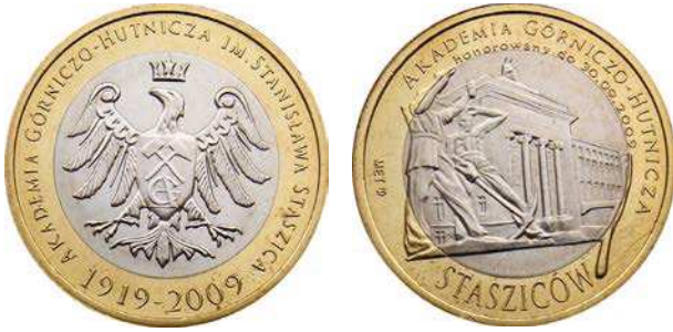
Dukat lokalny 7 Stasziców

sje w Mennicy Polskiej. Pierwsza w mosiądzu, średnica 27 mm, nakład 30.000 sztuk. Druga w srebrze Ag500, średnica 32 mm, nakład 1000 sztuk. Autorem projektu jest Witold Nazarkiewicz.