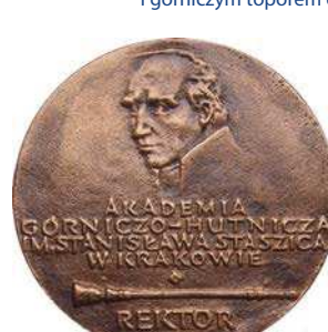
Medal rektorski Akademii Górniczo-Hutniczej z godłem uczelni na rewersie