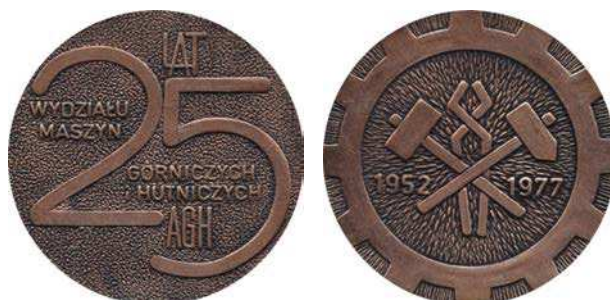
Medal 25-lecia Wydziału Maszyn Górniczych i Hutniczych z 1977 roku

W 2002 roku został wyemitowany medal z okazji 50-lecia Wydziału Elektrotechniki, Automatyki, Informatyki i Elektroniki Akademii Górniczo-Hutniczej w Krakowie. Na awersie przedstawiono schemat obwodu elektronicznego z wpisaną liczbą 50, poniżej napis: LAT. W otoku napis: WYDZIAŁ ELEKTROTECHNIKI, AUTOMATYKI, INFORMATYKI I ELEKTRONIKI. Na rewersie umieszczono godło uczelni, w otoku napis: AKADEMIA GÓRNICZO-HUTNICZA / IM. STANISŁAWA STASZICA W KRAKOWIE. Medal zaprojektowała Urszula Walerzak. Średnica wynosi 60 mm. W nakładzie 806 sztuk wybiła Mennica Polska, tombak srebrzony i oksydowany.