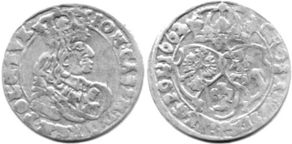
Ryc.142. Szóstak koronny B62 B T-T odmiany 1.1. Kop.1653.