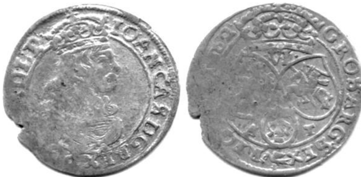
Ryc.145. Szóstak koronny B62 C A-T odmiany 3. Cz.2216; KK.213.