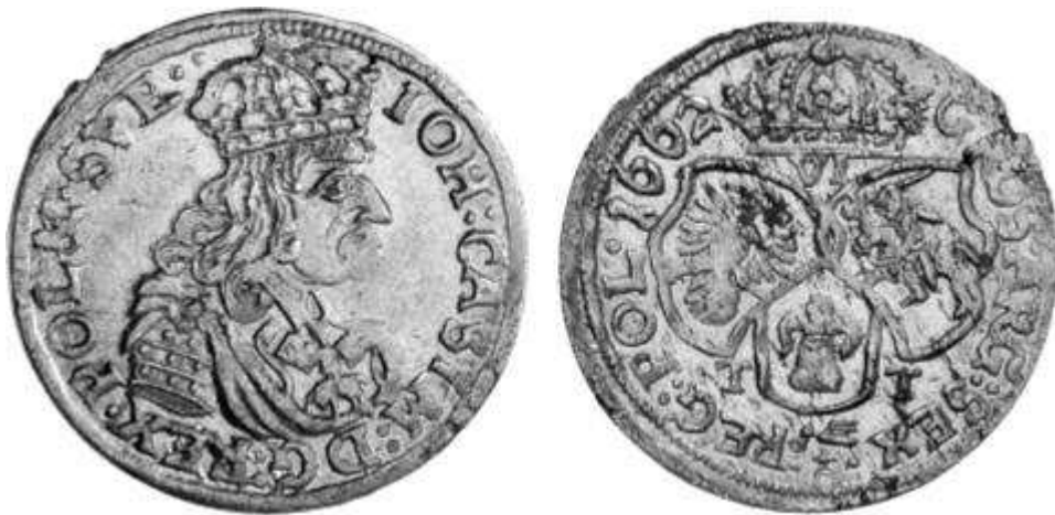
Ryc.135. Szóstak koronny B62 B T-T 1. KK.204.; Kop.1650.

Szóstaki bydgoskie z początku pierwszego półrocza 1662 roku to monety bite w omówionej już, ustalonej od 1660 roku tradycyjnej stylistyce, z popiersiami typu „B” na awersach oraz charakterystyczną kompozycją rewersów sygnowanych inicjałami T-T Tomasza Tymfa (Ryc.135.). Stanowią one grupę monet, której rzetelne zbadanie pomogłoby ustalić w miarę dokładną wielkość emisji oraz określić ramy czasowe jej wybicia, co w konsekwencji pozwoliłoby precyzyjniej ustalić moment, w którym w Bydgoszczy rozpoczęli swą działalność rytownicy sprowadzeni z mennicy poznańskiej i odpowiedzieć, być może, na pytanie zasygnalizowane już przy omawianiu dorobku mennicy poznańskiej – czy mennica ta była czynna w okresie od kwietnia do lipca 1662 roku ? *