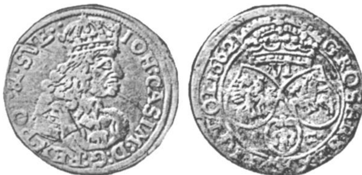
Ryc.137. Szóstak koronny B62 B A-T C Haut. – hybryda autorska. Źródło: Lwowskie Muzeum Historyczne nr inw. 42163.*

Jednoczesne występowanie na szóstakach bydgoskich odwzorowań stempli autorstwa dwóch różnych rytowników wcale nie musi oznaczać ich jednoczesnego zatrudnienia – należy raczej przyjąć, iż dotychczasowemu mistrzowi ryłca za współpracę podziękowano a stemple przez niego wyprodukowane wykorzystano, jak na to wskazuje istnienie przedstawionych powyżej szóstaków hybrydowych, aż do pełnego ich zużycia. Snycerz ten zostanie ponownie zatrudniony w mennicy bydgoskiej dopiero przez T. L. Boratini'ego, bezpośrednio po niesławnej ucieczce obu braci Tymfów w roku 1667 – pięknie dopracowane popiersia typu „B” noszące niewątpliwe ślady jego ręki możemy zobaczyć na awersach bydgoskich ortów koronnych z lat 1667 i 1668 (Ryc.138.).