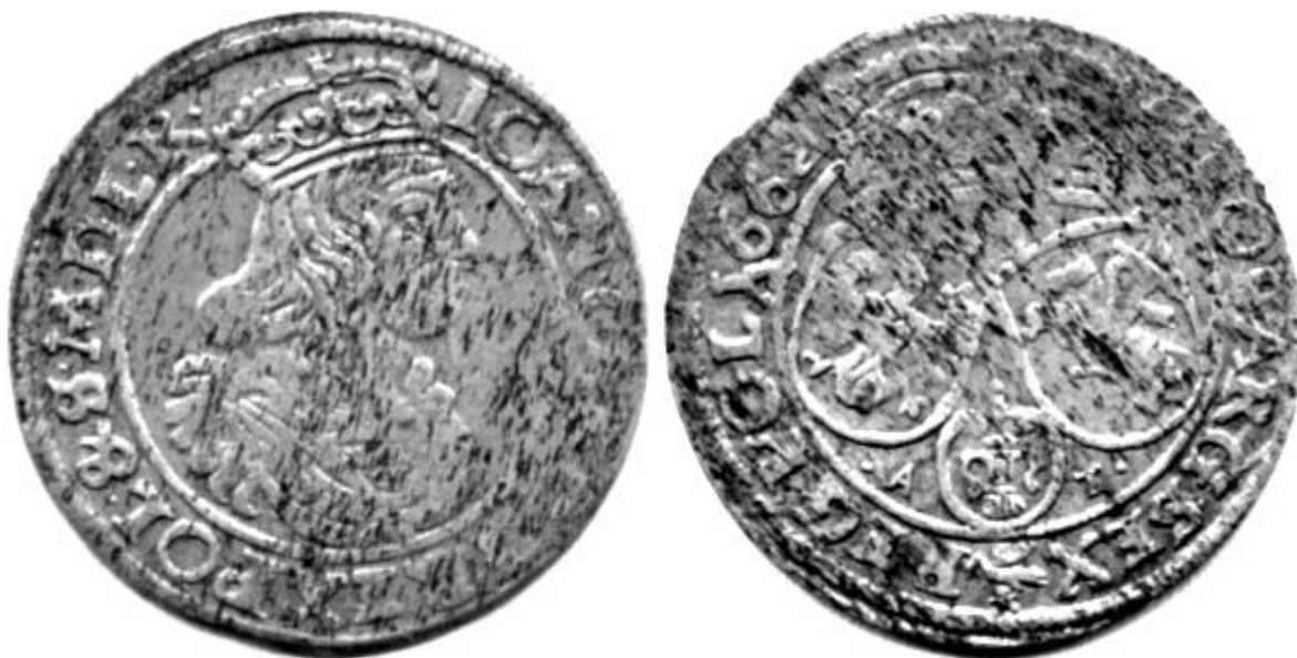
Ryc.144. Szóstak koronny B62 C A-T odmiany 2. Odmiana nienotowana.