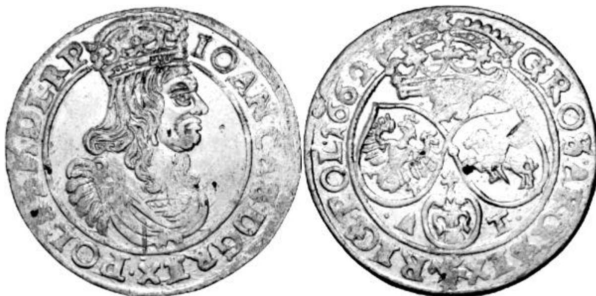
Ryc.140. Szóstak koronny B62 C A-T 1. KK.214.; Kop.1662.

Dokonując próby ustalenia chronologii emisji szóstakowych w ówczesnej mennicy bydgoskiej musimy zaznaczyć, iż prawdopodobne istnienie kilku stanowisk produkujących te monety obarcza nasze rozważania dużo większym marginesem błędu niż dzieje się to w przypadku analizy produkcji innych mennic koronnych*. Niemniej, z całą pewnością możemy założyć, iż szóstakowy rok menniczny 1662 w Bydgoszczy inauguruje szóstaki typu B T-T (Ryc.135.) Tomasza Tymfa, bite od początku stycznia do końca marca na pewno, a prawdopodobnie jeszcze w kwietniu i maju, o czym świadczy wcale nierzadkie ich występowanie i względna mnogość wariantów stempla awersu. Koniec drugiego kwartału 1662 to sygnalizowany już okres przejściowy** charakteryzujący się emisjami hybrydowymi, których rzadkość występowania wskazuje na stosunkowo krótki (zapewne czerwcowy) okres produkcji – w przypadku hybryd autorskich typu C T-T B (Ryc.136.) oraz szóstaków typu C T-T C (Ryc.139) do chwili przejścia odpowiedzialności rozliczeniowej za produkcję menniczą przez Andrzeja Tymfa (początek lipca) a w przypadku hybryd autorskich typu B A-T C (Ryc.137.) do momentu technicznego wyeksploatowania stempla awersu. Druga połowa roku 1662 to już bezwzględna dominacja szóstaków typu C A-T (Ryc.140) - typu charakteryzującego mennicę bydgoską już do końca kariery menniczej obu braci Tymfów na terenie Rzeczypospolitej, czyli do początku 1667 roku.