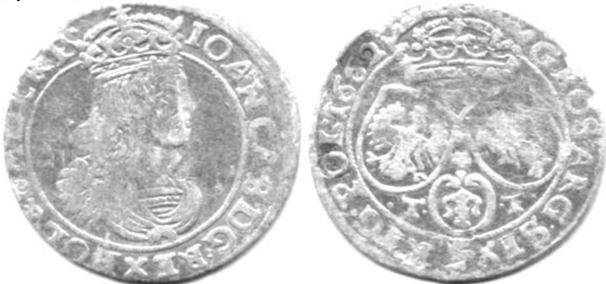
Ryc.139. Szóstak koronny B62 C T-T C Htyp. – hybryda typologiczna.

Pomiędzy oboma przedstawionymi typami szóstaków hybrydowych należałoby znaleźć miejsce dla wspomnianego już przy omawianiu dorobku mennicy poznańskiej, szóstaka typu C T-T C – monety o cechach hybrydy nie autorskiej lecz typologicznej - ze stemplami awersu i rewersu zaprojektowanymi już w nowej stylistyce lecz sygnowanej jeszcze inicjałami T-T Tomasza Tymfa (Ryc.139.).