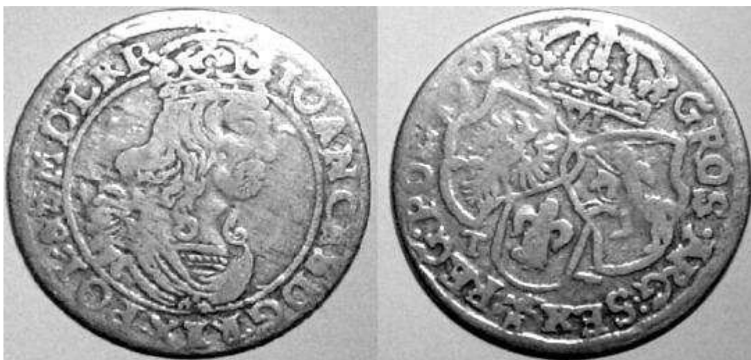
Ryc.136. Szóstak koronny B62 C T-T B Haut. – hybryda autorska.