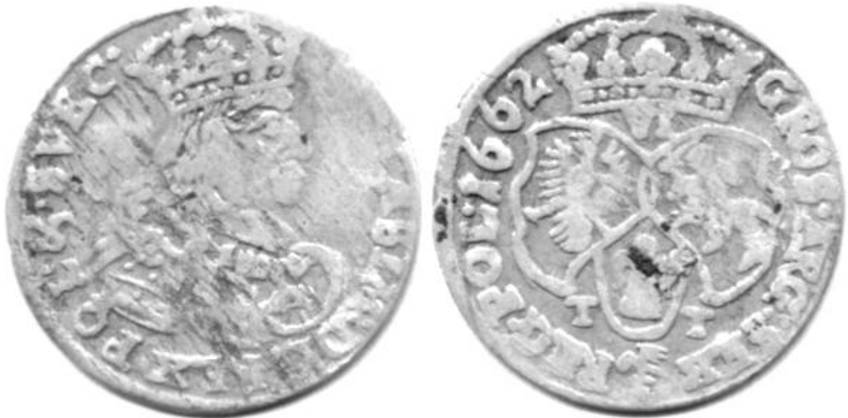
Ryc.143. Szóstak koronny B62 B T-T odmiany 2. Odmiana nienotowana.

Ze względu na ogromną pracochłonność i niemałe koszty kwerendy, której rzetelne przeprowadzenie było konieczne do zebrania odpowiedniej ilości materiału badawczego, nie zawsze udawało się go zdobyć w najwyższej jakości, czasem też konieczne było poprzestanie poszukiwań w nie zawsze najkorzystniejszym momencie – z tego powodu pragnę przeprosić, że nie wszystkie przedstawione na ilustracjach monety są w wymarzonej formie zachowania, choć wszystkie, jak starałem się ukazać, spełniają kryterium wystarczającej czytelności.