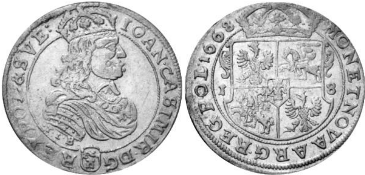
Ryc.138. Popiersie typu „B” na awersie orta koronnego B68 B TLB.

Pomiędzy oboma przedstawionymi typami szóstaków hybrydowych należałoby znaleźć miejsce dla wspomnianego już przy omawianiu dorobku mennicy poznańskiej, szóstaka typu C T-T C – monety o cechach hybrydy nie autorskiej lecz typologicznej - ze stemplami awersu i rewersu zaprojektowanymi już w nowej stylistyce lecz sygnowanej jeszcze inicjałami T-T Tomasza Tymfa (Ryc.139.).