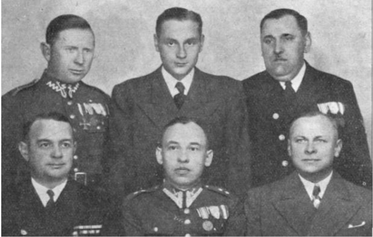
Rada Nadzorcza spółdzielni.

29. Wysokość udziału wynosiła do 1931 r. 10 zł, później 50 zł, co dawało 14-17 tys. zł. W latach 1931-1933 gromadzi również 5-10 tys. wkładów oszczędnościowych członków.