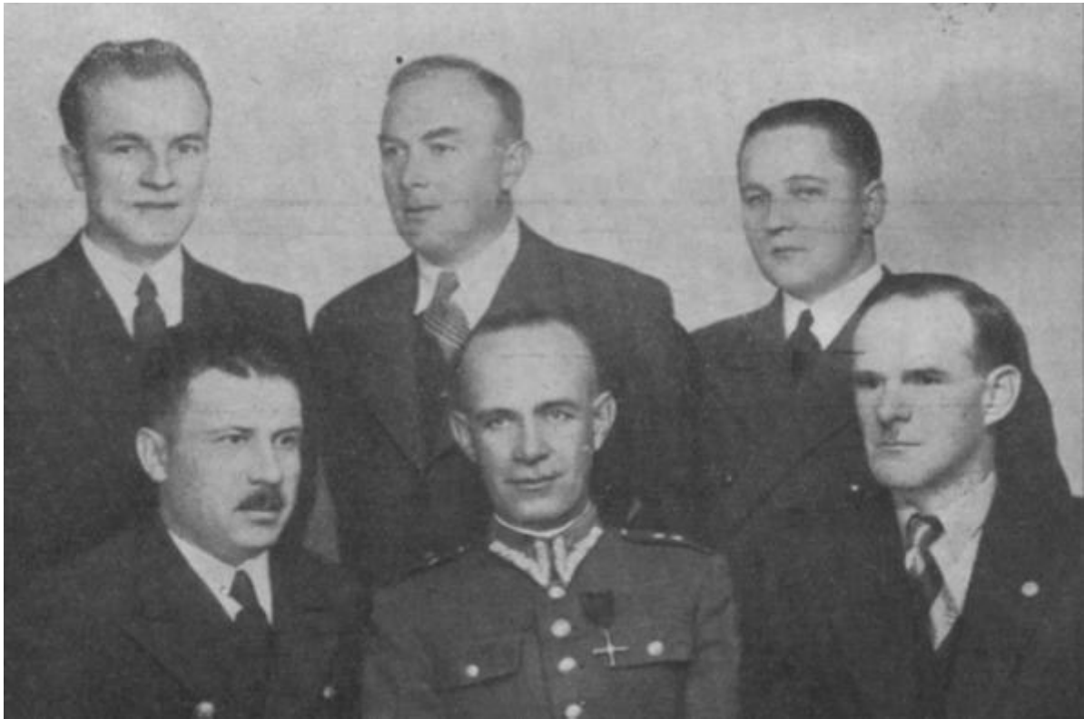
Zarząd i pracownicy spółdzielni

Bardzo ważnym jest odszukanie w archiwach lub ogłaszanych w prasie bilansów spółdzielni, podających nominalną wysokość emisji i lata jej obiegu. Statutowym pismem do ogłoszeń spółdzielni MW był w różnych latach Wojskowy Przegląd Spółdzielczy, Przegląd Morski, Polska Zbrojna i Społem (cywilne). Z WPS znane są takie bilanse z lat 1930-1934. W 1930 r. wysokość emisji wynosiła 5.000,00 zł, lub tyle wydano do obiegu, ale w 1931 r. dobito 930 monet 5 złotych uzupełniających emisję do kwoty 9.650,00 zł. Emisję taką w latach 1934-1935 znów zmniejszono do 5.000,00 zł, a w dalszych latach jeszcze bardziej. Niewątpliwie związane to było z radykalnym ograniczaniem sprzedaży na kredyt. Nie datowane monety 10, 20, 50 gr i 1 zł mogły być wybite pod koniec 1928 r. lub w początkach 1929 r. Wybiły je Zakłady Przemysłowe Bronisława Grabskiego w Łodzi, a projektantem i wykonawcą stempli mennicznych był znany mi osobiście grawer Maurycy Kendrzeński (ur. 1893 – zm. 1976).