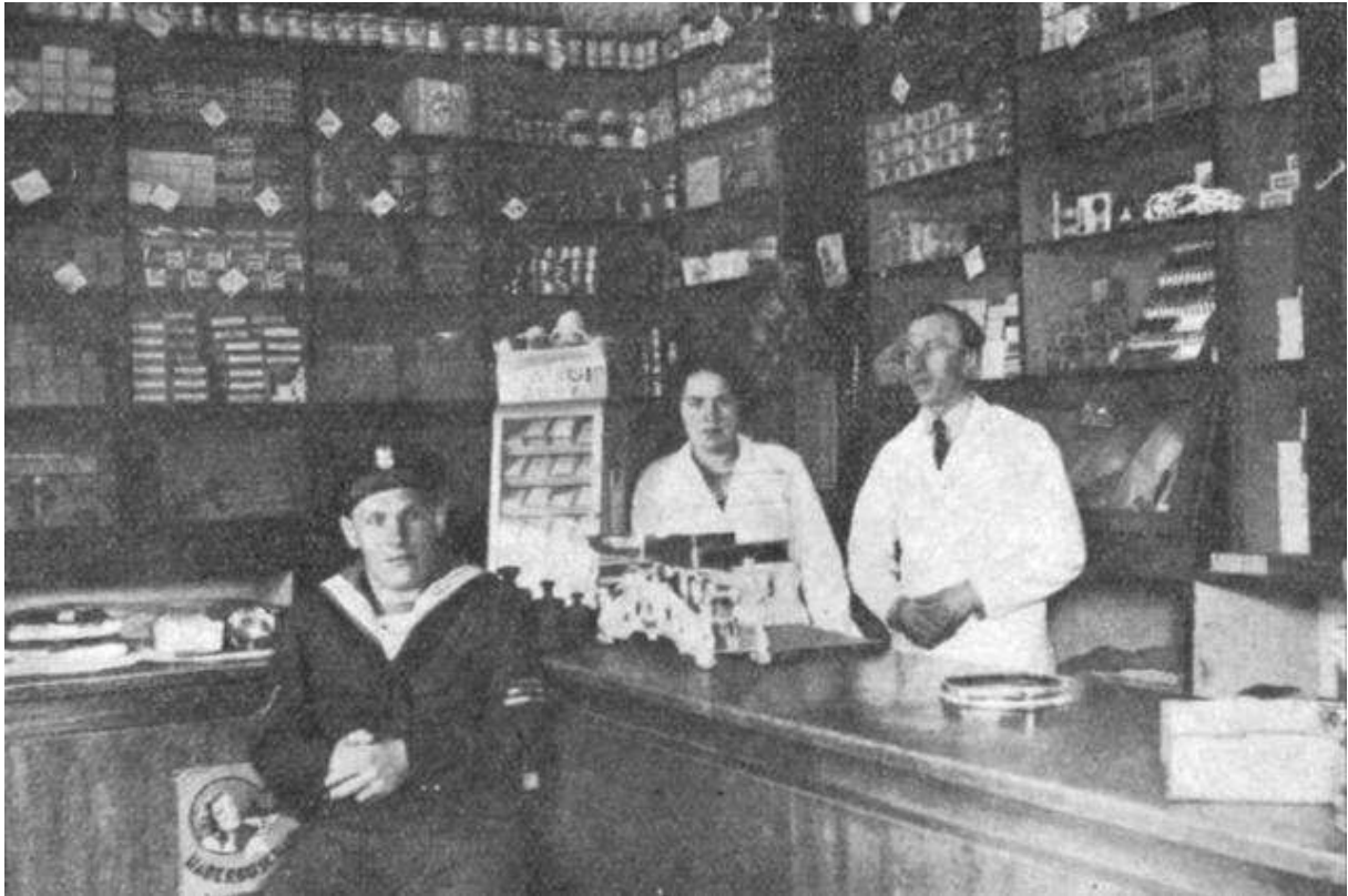
Jeden ze sklepów spółdzielni.

przy ul. Morskiej 67, w 1936 r. sklep 9. w Helu, w 1937 r. sklep 10. w świetlicy Kadry Floty i gdzieś sklep Nr 11 (zatajanie adresu sugeruje 2. Baon Morski).