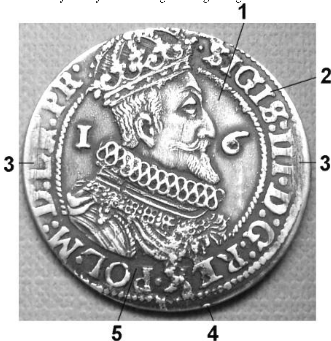
Awers monety fałszywej:

Rocznik 1624 jest jednym z najpopularniejszych, lecz po raz kolejny okazuje się, że monety popularne i raczej niedrogie nie powinny osłabiać naszej czujności. Niedawno spotkałem niebezpieczny, starannie wykonany odlew orta gdańskiego z tego rocznika.