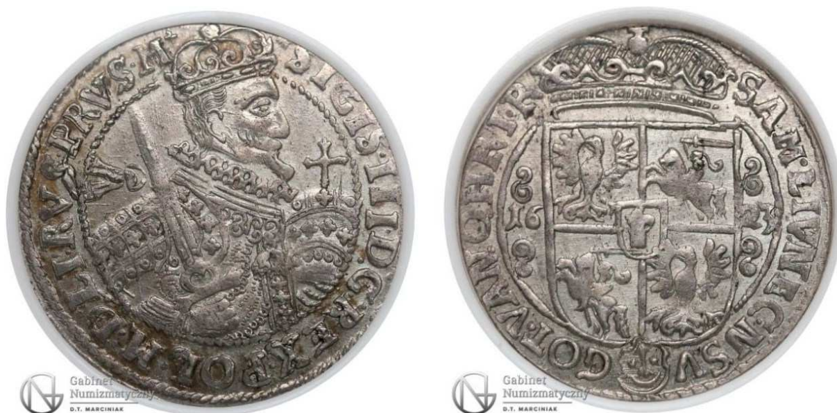
Ort koronny 1623

Na tym też zakończymy tę część artykułu, ponieważ w następnej – ostatniej skupimy się na wyższych nominałach monet, pełniących głównie funkcję propagandową i zaspokajającą potrzeby „podarunkowe” z różnych okazji. Autor zdaje sobie też sprawę, że opisane w tej części monety zostały potraktowane w sposób bardzo powierzchowny, są one jednak tematem na osobne publikacje.