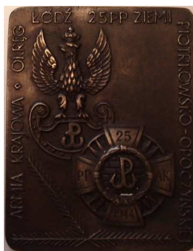
Armia Krajowa. Okręg Łódź. 25 PP Ziemi Piotrkowsko-Opoczyńskiej. Koncepcja - Bohdan Borowski "Walek". Projekt graficzny, model i wykonanie - Teodor Kawecki - 1990 r. Odlew w brązie, 69,5 x 90,5 mm