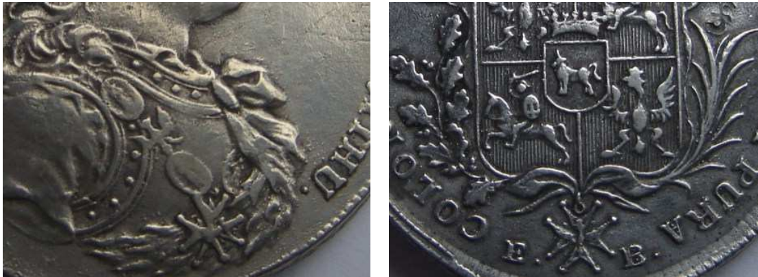
Powiększony fragment awersu talara z 1766 r. i rewersu z 1788 r. z Orderem Orła Białego

Order Orła Białego pojawia się także na medalach nadwornego medaliera króla Stanisława Augusta – Jana Filipa Holzhaeussera, między innymi na portretowym medalu Stanisława Lubomirskiego, marszałka koronnego. Na jego płaszczu widoczna jest gwiazda orderowa i szarfa na zbroi.