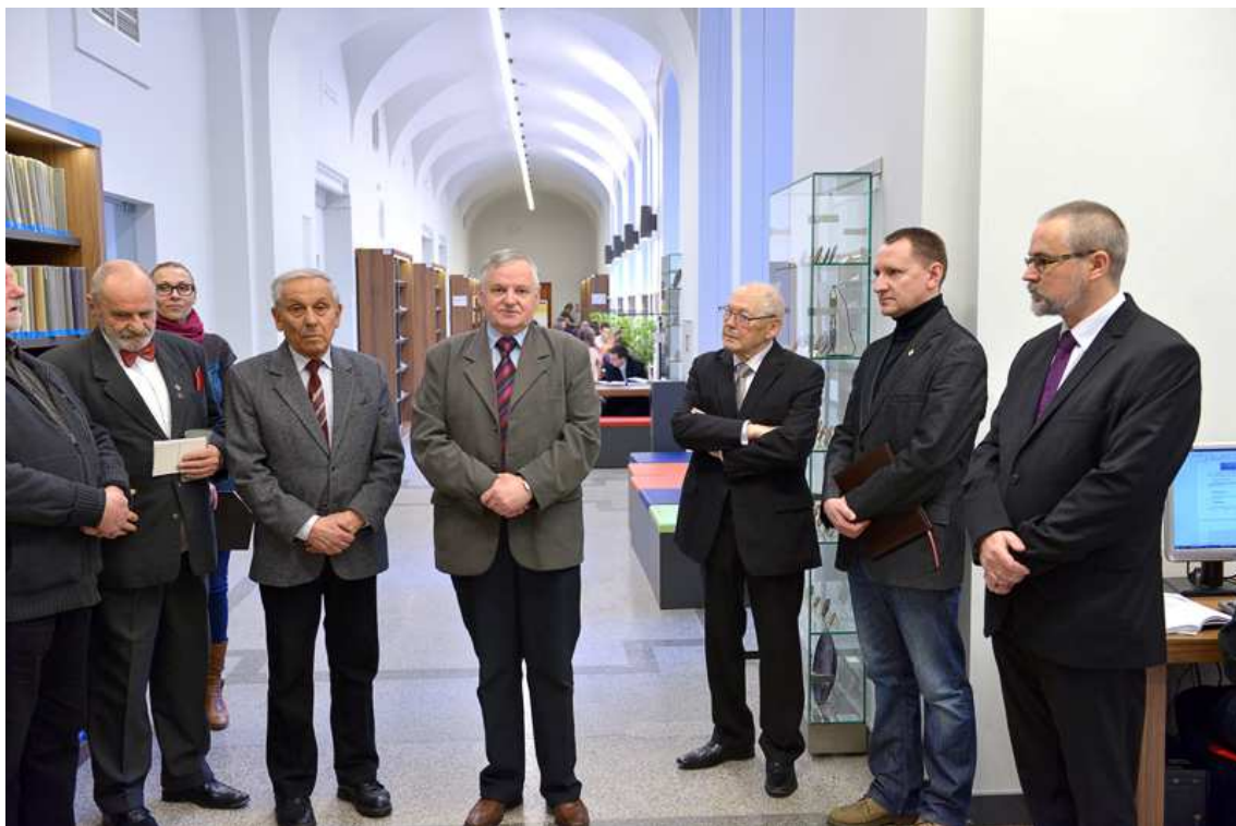
Uroczysty wernisaż, Biblioteka Główna Politechniki Gdańskiej, 2 lutego 2015 r.