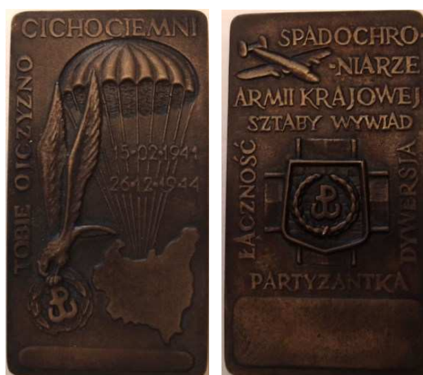
Cichociemni - Tobie Ojczyżno. Projekt graficzny Bronisław Czepczak-Górecki "Zwijak". Model i wykonanie Teodor Kawecki - 1987. Odlew w brązie, 103 x 56,5 mm