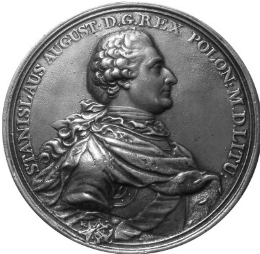
Medal króla Stanisława Augusta

Na medalu portretowym króla Stanisława Augusta z 1791 r.