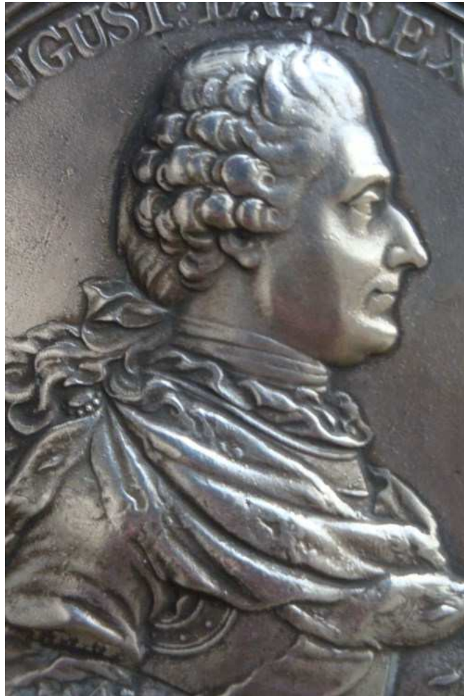
Portret króla Stanisława Augusta