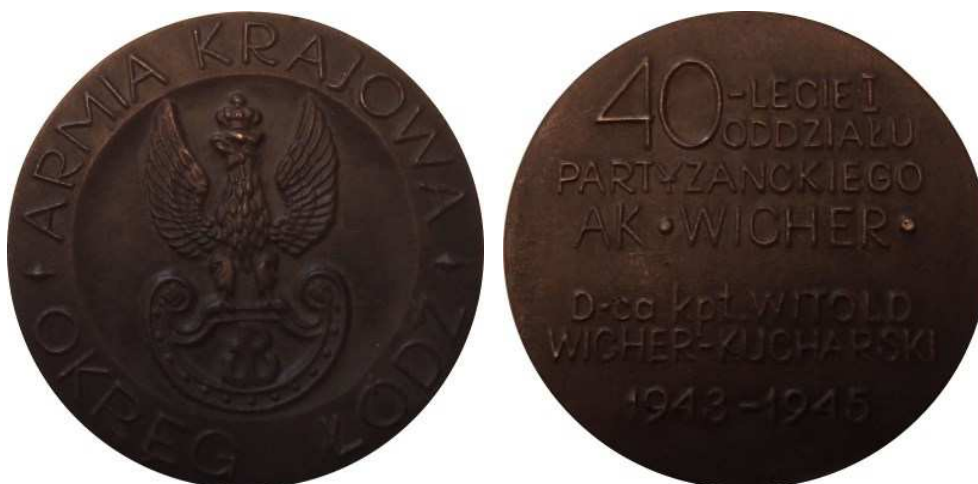
Armia Krajowa, Okręg Łódź. 40-lecie I Oddziału Partyzanckiego AK "Wicher". Projekt graficzny - Bohdan Borowski "Walek". Model i wykonanie - Teodor Kawecki - 1983 r. Odlew w brązie i cynku, Ø 74 mm