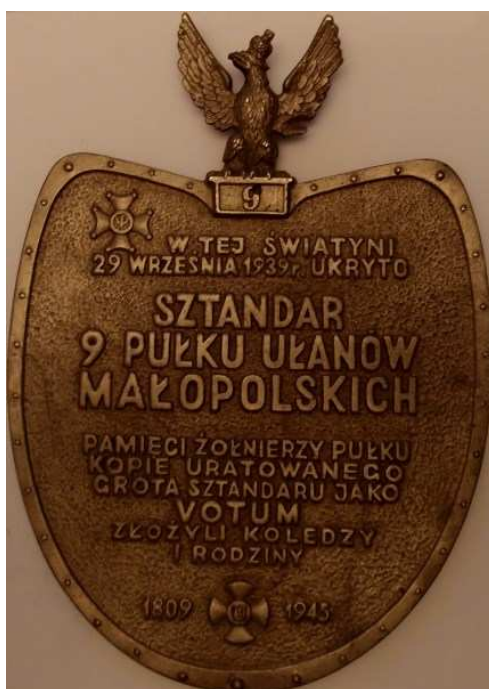
W tej świątyni 29 września 1939 ukryto sztandar 9 Pułku Ułanów Małopolskich. Miniatura tablicy wykonanej na zlecenie kombatantów 9 Pułku Ułanów Małopolskich do kościoła św. Antoniego w Warszawie, gdzie ukryto sztandar po kampanii wrześniowej 1939. Projekt, model i wykonanie – T. Kawecki – odlew w cynku i mosiądzu 14,6 x 20,2 cm - wykonano około 10 sztuk