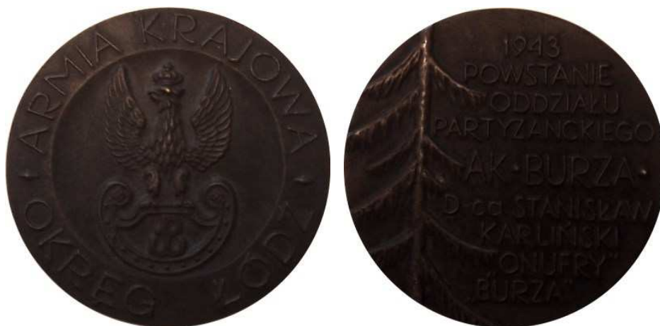
Armia Krajowa, Okręg Łódź. 1943, Powstanie Oddziału Partyzanckiego AK 'Burza'. Projekt graficzny - Bohdan Borowski - "Walek". Model i wykonanie - Teodor Kawecki - 1983 r. Odlew w brązie i cynku, Ø 74 mm