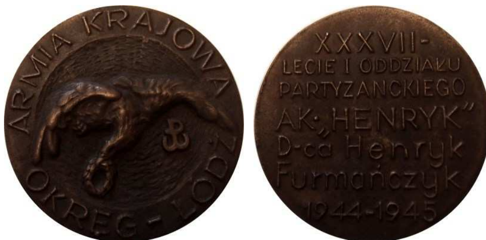
Armia Krajowa, Okręg Łódź. XXXVII-lecie I Oddziału Partyzanckiego AK "Henryk". Projekt graficzny - Bohdan Borowski "Walek". Model i wykonanie - Teodor Kawecki - 1981 r. Odlew w brązie i cynku, Ø 73 mm