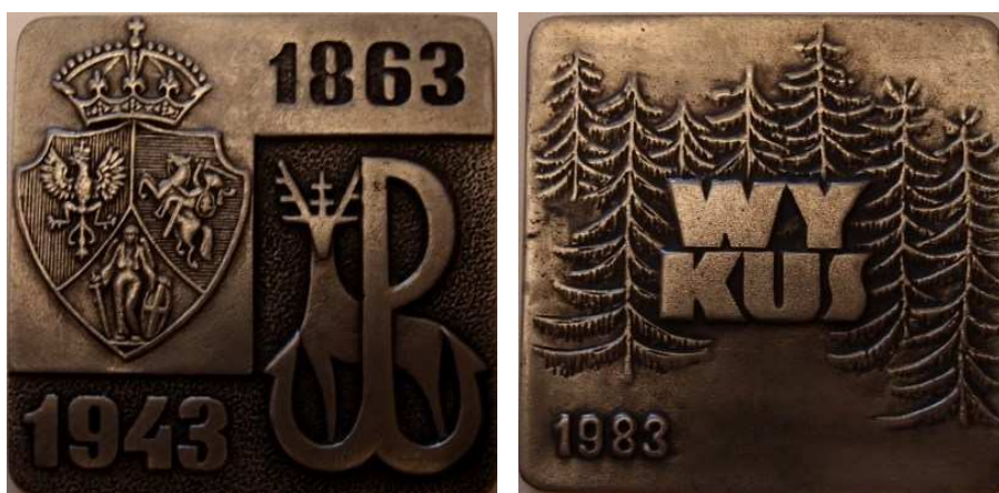
40 Rocznica powstania oddziału Ponurego i 120 rocznica Powstania Styczniowego. Projekt graficzny - Andrzej Kasten. Model i wykonanie - Teodor Kawecki - 1983 r. Odlew w cynku (główny nakład), 66 x 66 mm. Odlew w brązie, mosiądzu, 66,5 x 66,5 mm