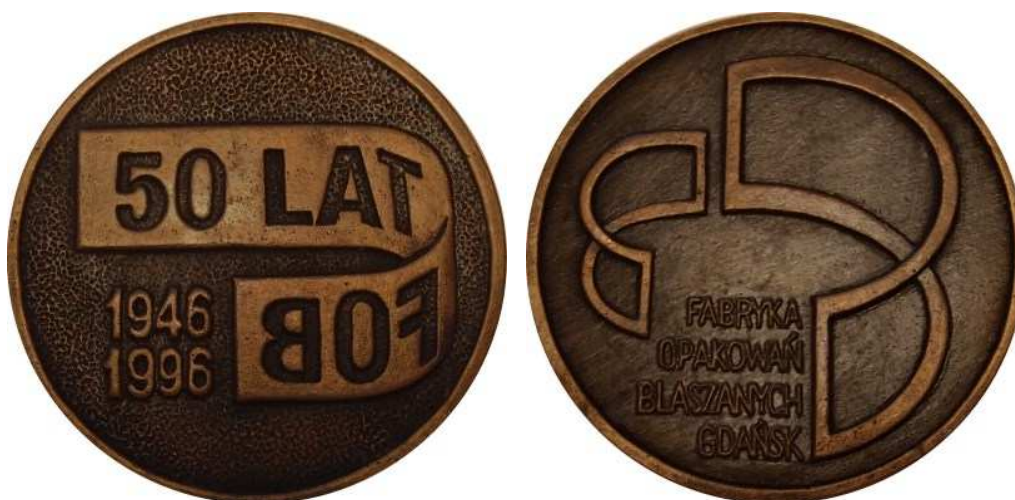
50 lat FOB. Fabryka Opakowań Blaszanych, Gdańsk. Projekt graficzny - Marek Adamczewski. Model i wykonanie - Teodor Kawecki. Odlew w brązie, Ø 68,5 mm