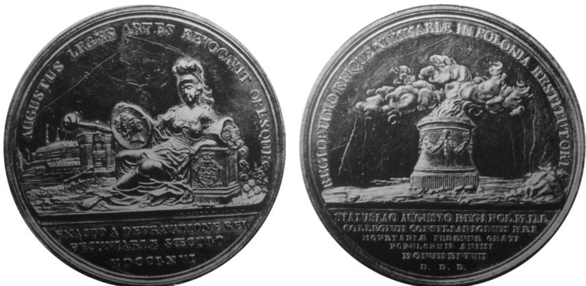
Medal Holzhaeussera na otwarcie Mennicy Warszawskiej