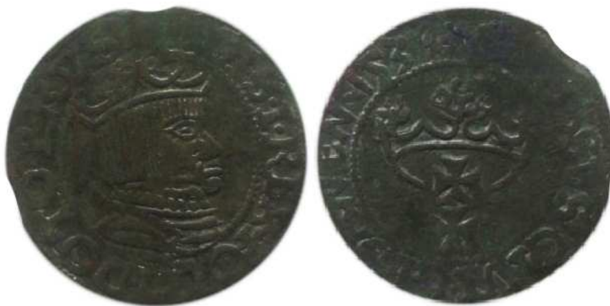
Ryc. 1. Fałszywa moneta groszowa Mennicy gdańskiej z 1539 roku.

Objaśnienia do falsyfikatów groszowych z czasów Zygmunta Starego (1506-1548)