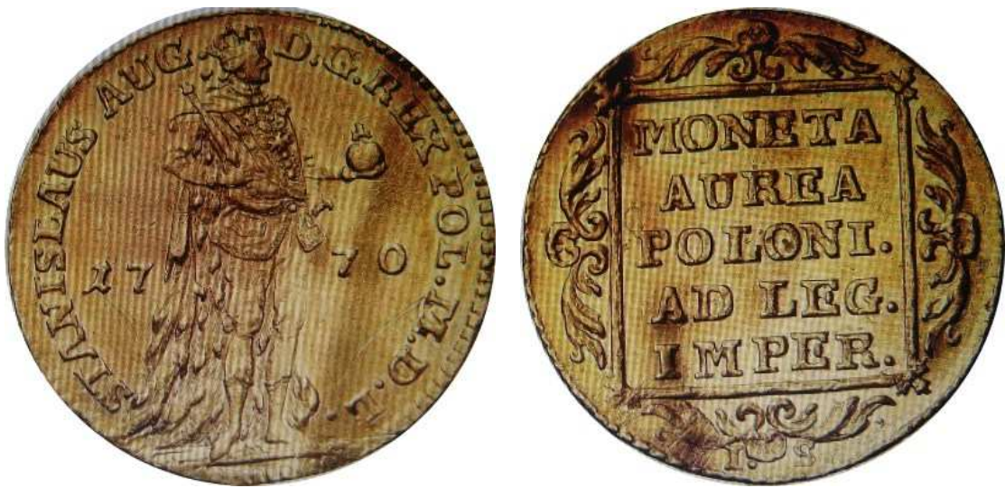
Dukat koronny z 1770 roku