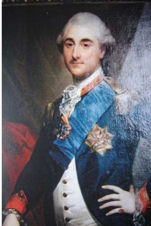
Portret króla Stanisława Augusta z szarfą i gwiazdą orderową

Kiedy na dworze odbywały się nadzwyczajne uroczystości, jak koronacja, król jako Wielki Mistrz Orderu zakładał na szyję złoty ozdobny łańcuch z krzyżem orderowym.