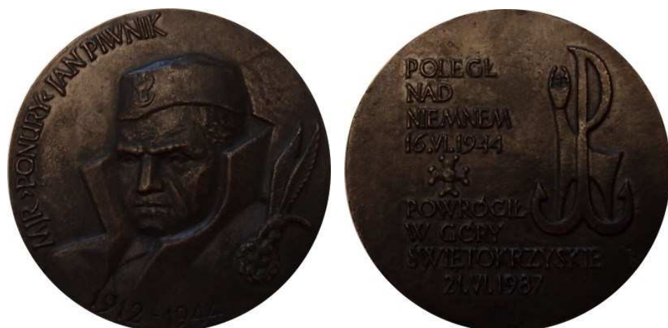
Ponury - Major Jan Piwnik. Projekt graficzny - Bohdan Borowski "Walek". Model i wykonanie - Teodor Kawecki - 1987 r. Odlew w brązie, Ø 73 mm