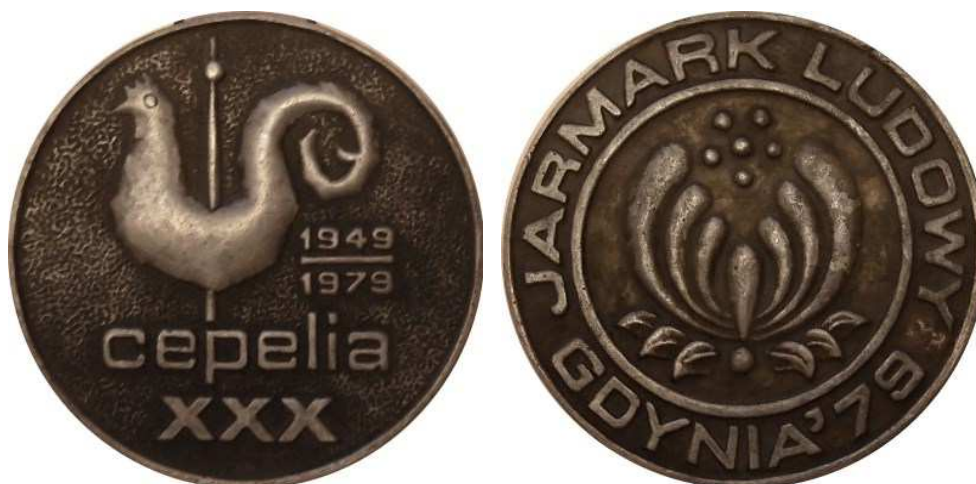
Cepelia XXX. Jarmark Ludowy, Gdynia '79. Projekt, model i wykonanie - Teodor Kawecki - 1979 r. Odlew w cynku, Ø 64 mm