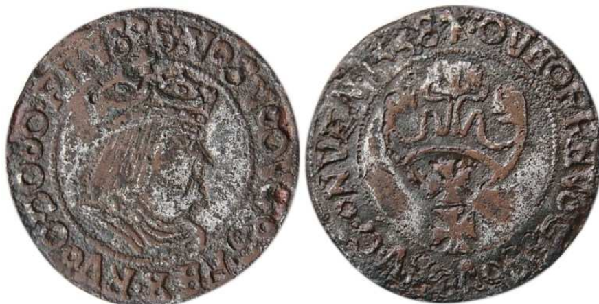
Ryc. 2. Fałszywa moneta groszowa Mennicy gdańskiej z datą "1558"