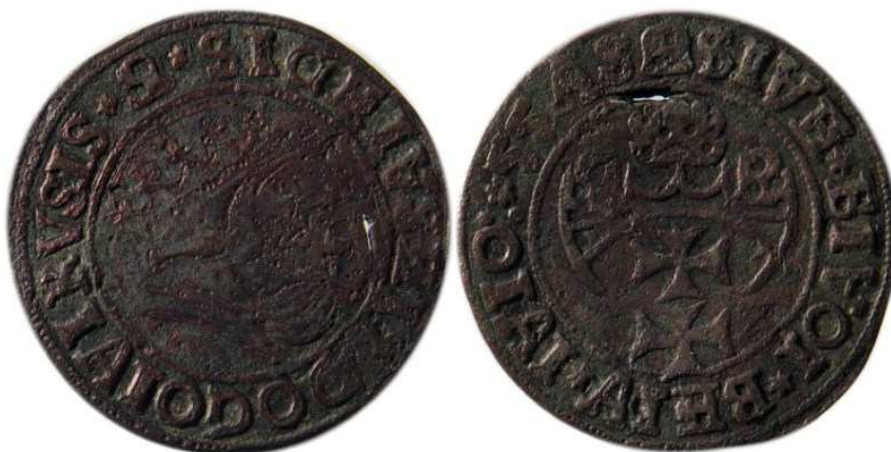
Ryc. 3. Fałszywa moneta groszowa Mennicy gdańskiej