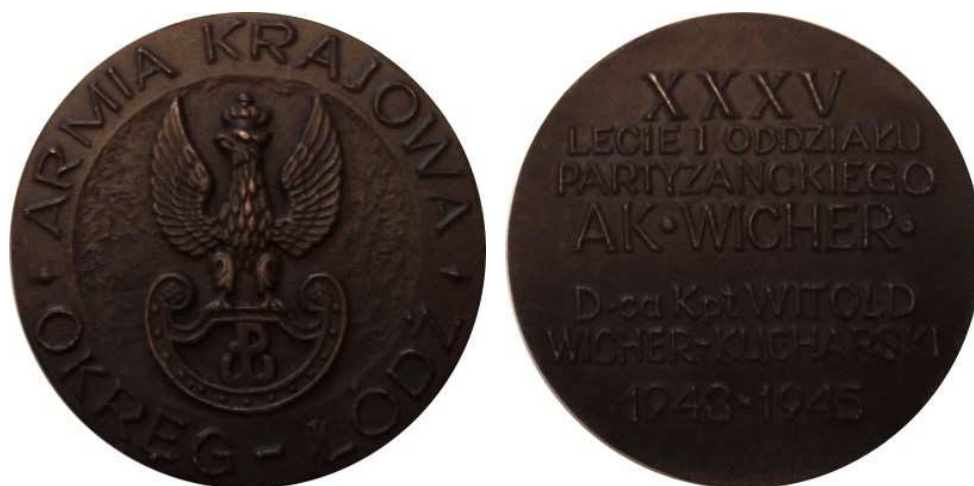
Armia Krajowa, Okręg Łódź. XXXV lecie I Oddziału Partyzanckiego AK 'Wicher'. Projekt graficzny - Bohdan Borowski "Walek". Model i wykonanie - Teodor Kawecki - 1978 r. Odlew w brązie i cynku, Ø 74 mm