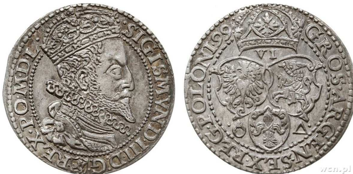
Szóstak malborski z pierwszej serii (1599), źródło: Archiwum Warszawskiego Centrum Numizmatycznego

Tym sposobem doszliśmy do najciekawszych i najpiękniejszych monet Zygmunta III – ortów. Bito je od roku 1618 w mennicy bydgoskiej. I warto się nad nimi niżej pochylić. Monety te bowiem na pewno nie spełniają funkcji informacyjnej (a przynajmniej nie docelowo), za to są wspaniałym przykładem monet o niebagatelnym znaczeniu propagandowym. Zaczniemy od występujących na niej tytułatury. Dla przypomnienia tytułatura Zygmunta III wyglądała następująco: Sigismundus Tertius Dei gratia rex Poloniae, magnus dux Lithuaniae, Russiae, Prussiae, Masoviae, Samogitiae, Livoniaeque, nec non Svecorum, Gothorum Vandalorum que hæreditarius rex . I na ortach występuje... w całości! I to dokładnie, choć niekiedy z błędami. Zawsze jednak na ortach widnieje pełna tytułatura królewska, świadcząca o ogromie jego władzy. Ponadto monety te posiadają przepięknie wykonane już nie popiersia, a półpostacie króla w pełnym majestacie, tj, z mieczem, koroną i jabłkiem. Półpostacie te są wykonane w dodatku z tak ogromnym kunsztem, że zasługują na miano dzieł sztuki medalierskiej. I nie są to bezpodstawne peany. Na monetach tych każdy najmniejszy kawałek kruszcu został w pełni wykorzystany by oddać potęgę królewską.