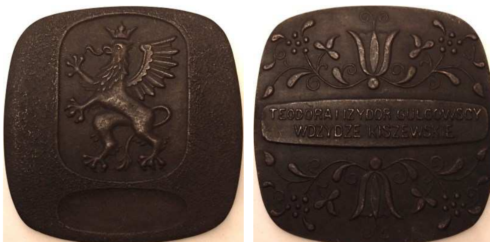
Teodora i Izidor Gulgowscy. Wdziedze Kiszewskie. Projekt, model i wykonanie - Teodor Kawecki. Odlew w cynku, brązie, 97 x 97 mm