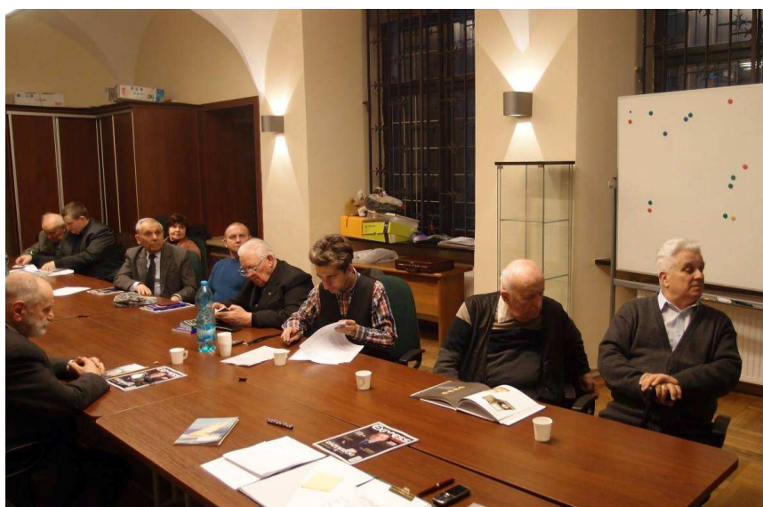
Uczestnicy Walnego Zebrania Sprawozdawczo-Wyborczego OG PTN