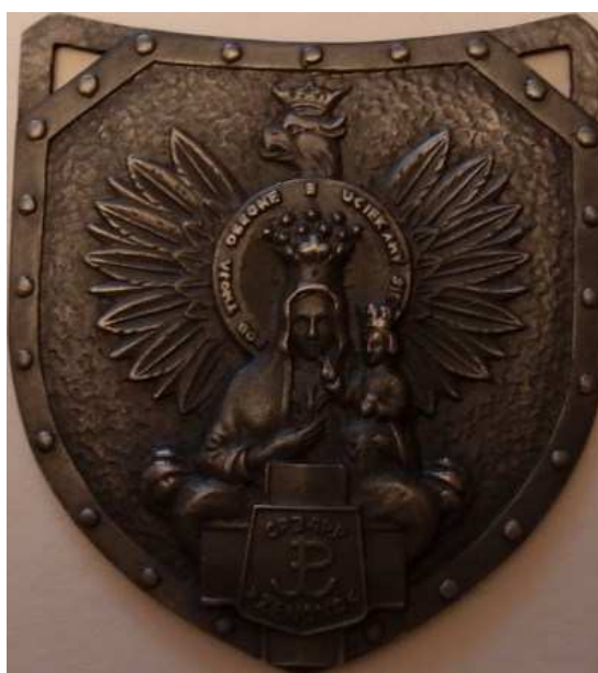
Przeróbka oryginalnego ryngrafu poprzez wstawienie odznaki 34 pp AK i odlanie w białym metalu - 70 x 78 mm. Oryginał wykonany przez jednego z żołnierzy pułku zesłanego na Syberię z kawałków aluminium wycinanych, nitowanych, grawerowanych. Wykonano kilka sztuk dla byłych żołnierzy