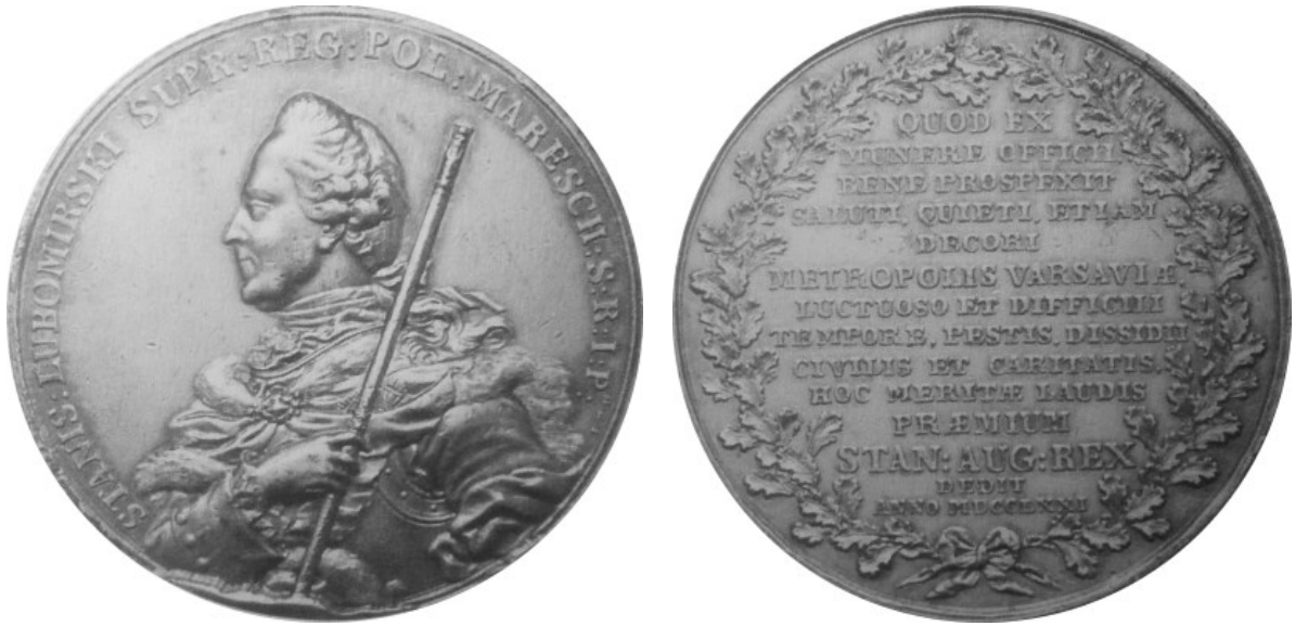
Medal Stanisława Lubomirskiego

Na medalu portretowym króla Stanisława Augusta z 1791 r.