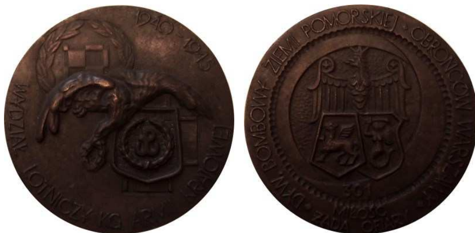
Wydział Lotniczy KG Armii Krajowej. Dyw. Bombowy Ziemi Pomorskiej Obrońców Warszawy. Projekt graficzny - Kazimierz Śliwa "Strażak2". Model i wykonanie - Teodor Kawecki - 1987 r. Odlew w brązie, Ø 79 mm