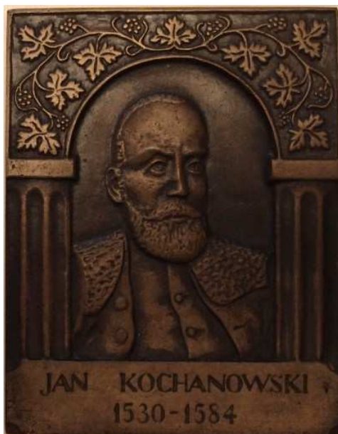
Jan Kochanowski. Projekt, model i wykonanie - Teodor Kawecki. Odlew w brązie, białym metalu (stop cyny), 78 x 100 mm