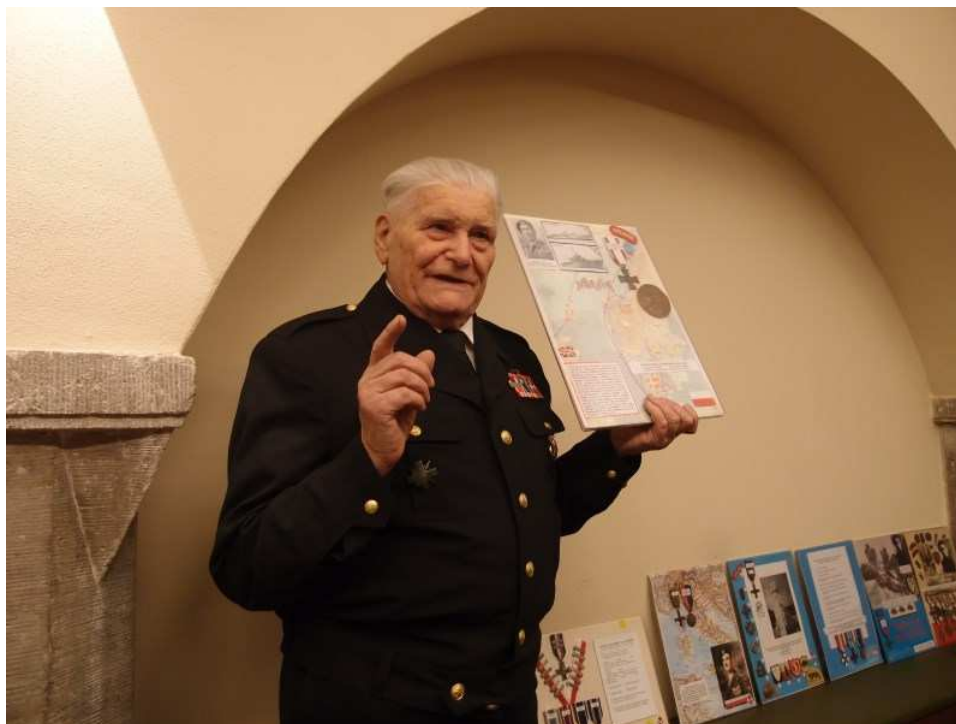
Autor w trakcie prelekcji na spotkaniu Oddziału Gdańskiego Polskiego Towarzystwa Numizmatycznego

Fundacja Oświatowa im. gen. pil. St. Karpińskiego w Gdyni