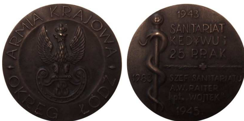
Armia Krajowa, Okręg Łódź. 1943 Sanitariat Kedywu i 25 P. P. AK. Projekt graficzny - Bohdan Borowski "Walek". Model i wykonanie - Teodor Kawecki - 1983 r. Odlew w brązie, Ø 74 mm