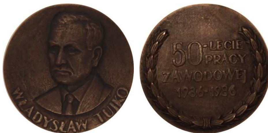
Władysław Tujko. 50-lecie pracy zawodowej. Projekt, model i wykonanie - Teodor Kawecki - 1986 r. Odlew brązie, Ø 70 mm