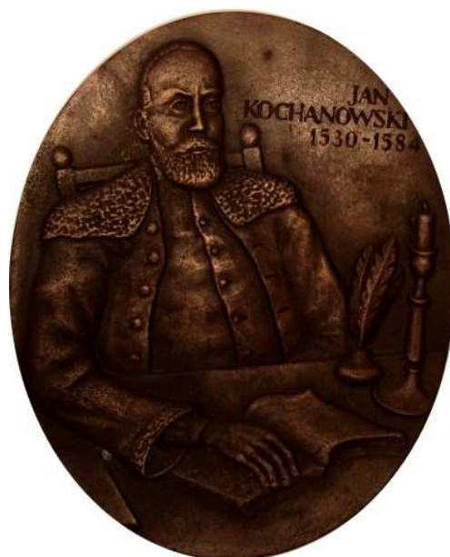
Jan Kochanowski. Projekt, model i wykonanie - Teodor Kawecki. Odlew w brązie, cynku, 115 x 142 mm