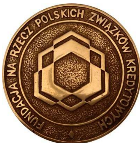
Fundacja na Rzecz Polskich Związków Kredytowych. Projekt, model i wykonanie - Teodor Kawecki. Odlew w mosiądzu, jednostronne, Ø 68 mm. Plakieta wykonana po reaktywacji SKOKów, łącznie z grotem sztandaru SKOK