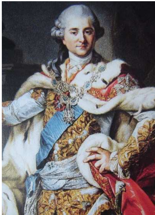
Portret koronacyjny Stanisława Augusta

Kiedy na dworze odbywały się nadzwyczajne uroczystości, jak koronacja, król jako Wielki Mistrz Orderu zakładał na szyję złoty ozdobny łańcuch z krzyżem orderowym.