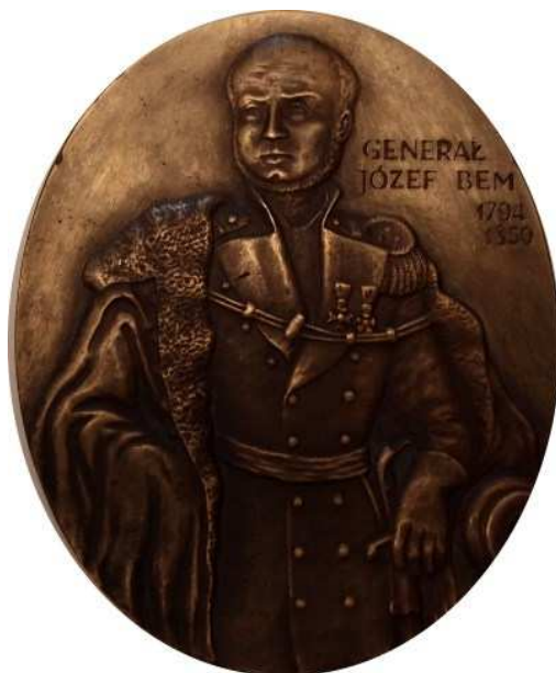
General Józef Bem. Projekt, model i wykonanie - Teodor Kawecki. Odlew w brązie, mosiądzu, cynku, 11,7 x 14,3 mm