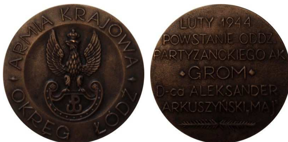
Armia Krajowa, Okręg Łódź. Luty 1944, Powstanie Oddz. Partyzanckiego AK 'Grom'. Projekt graficzny - Bohdan Borowski "Walek". Model i wykonanie - Teodor Kawecki - 1984 r. Odlew w brązie, Ø 75 mm