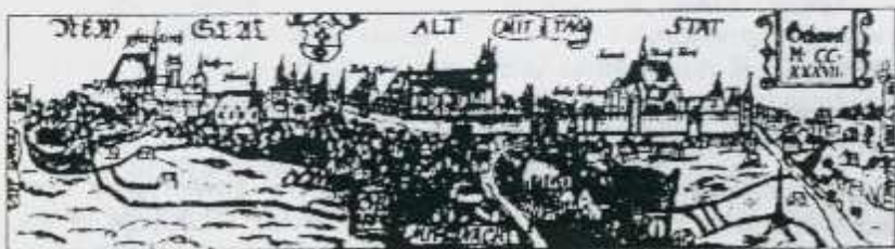
Panorama Elbląga wykonana przez Kacpra Hennebergera z 1554 roku