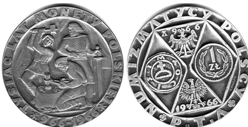
Medal z 1966 roku wybity z okazji 1000-lecia monety polskiej; tombak, 70 mm