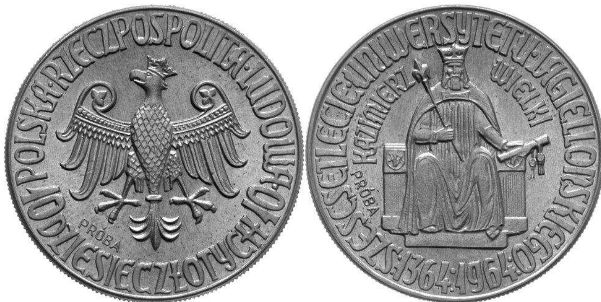
Fot. 1. Projekt monety autorstwa Józefa Gosławskiego z orłem w koronie nie wszedł do powszechnego obiegu, gdyż był zwyczajnie „niewygodny politycznie”; warto zwrócić uwagę na niestosowany nigdzie indziej, podwójny napis „próba” – wykonany jakby z ostrożności przez pracowników Mennicy Państwowej