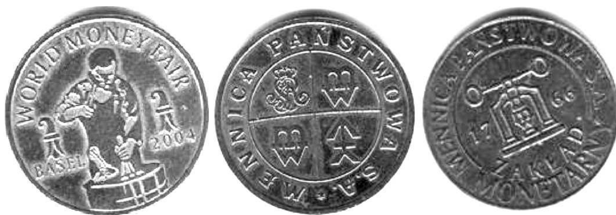
Żetony mennicze z 2004 roku; miedź 21 mm