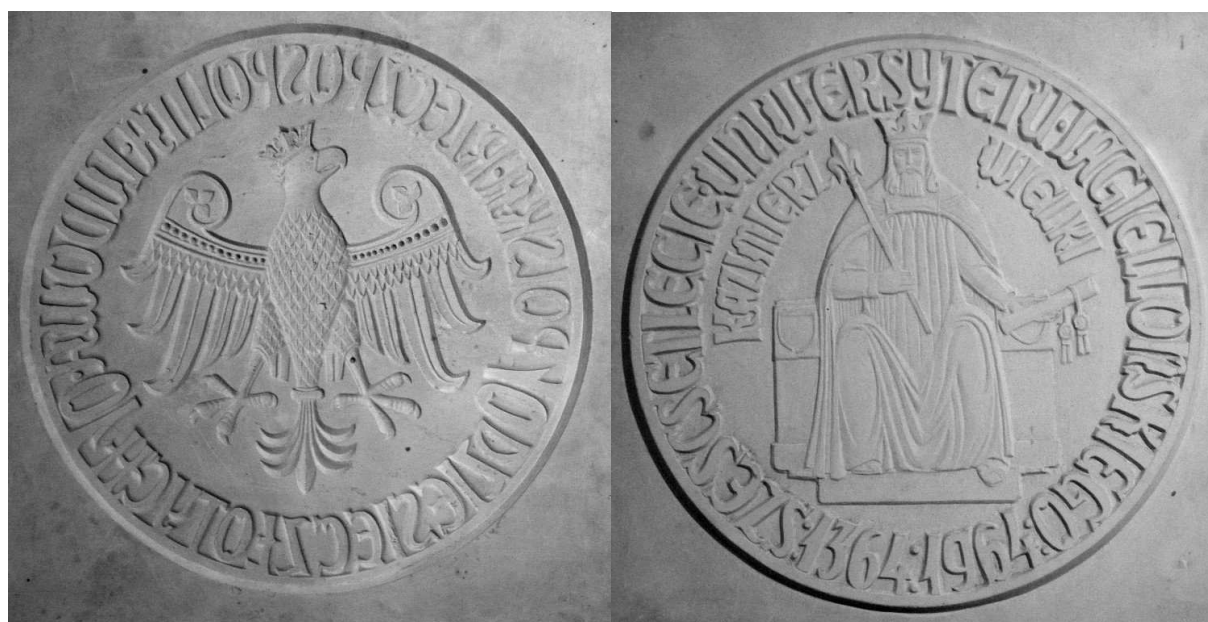
Fot. 2. Oryginalne modele gipsowe do awersu i rewersu monety 10 zł „600. lecie Uniwersytetu Jagiellońskiego” autorstwa Józefa Gosławskiego

W konkursie na projekt monety z okazji 600. lecia założenia Uniwersytetu Jagiellońskiego, zwyciężyła ostatecznie propozycja Wacława Kowalika, która doczekała się realizacji w postaci okolicznościowej monety obiegowej.