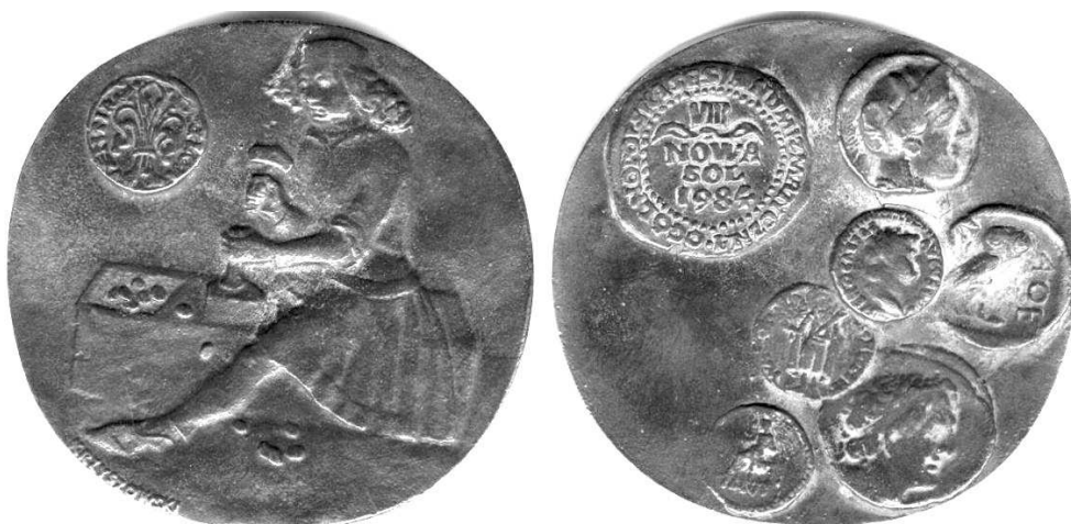
Medal z 1984 roku, wydany z okazji VIII Sesji Numizmatycznej w Nowej Soli; brąz krzemowy, patynowany, 86x83 owalny, lany