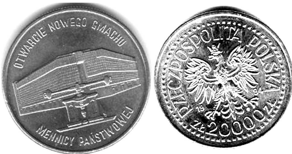
Polska, 20.000 zł z 1994 roku; miedzionikiel, 29 mm