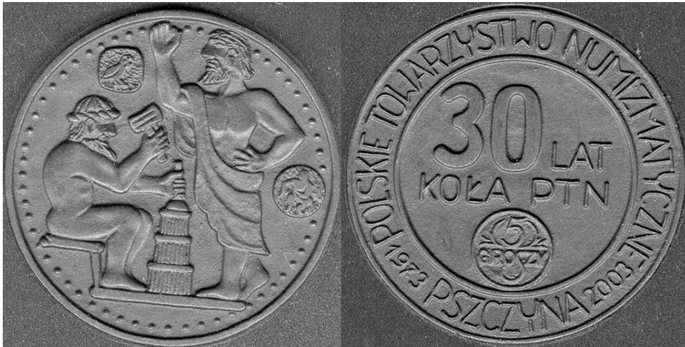
Medal z 2003 wydany z okazji 20 rocznicy koła PTN w Pszczynie; węgiel, 80 mm