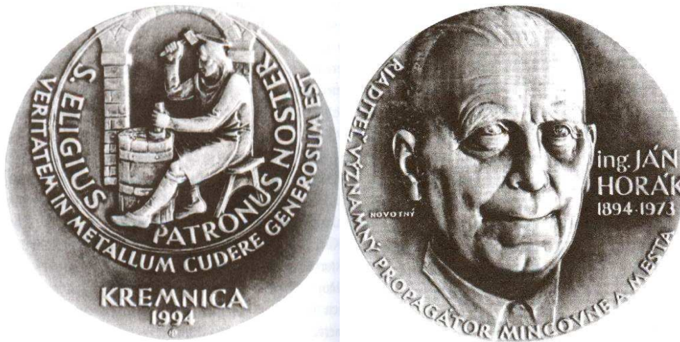
Medal z 1994 roku wybity z okazji 100 rocznicy urodzin Jana Horaka; tombak, 70 mm