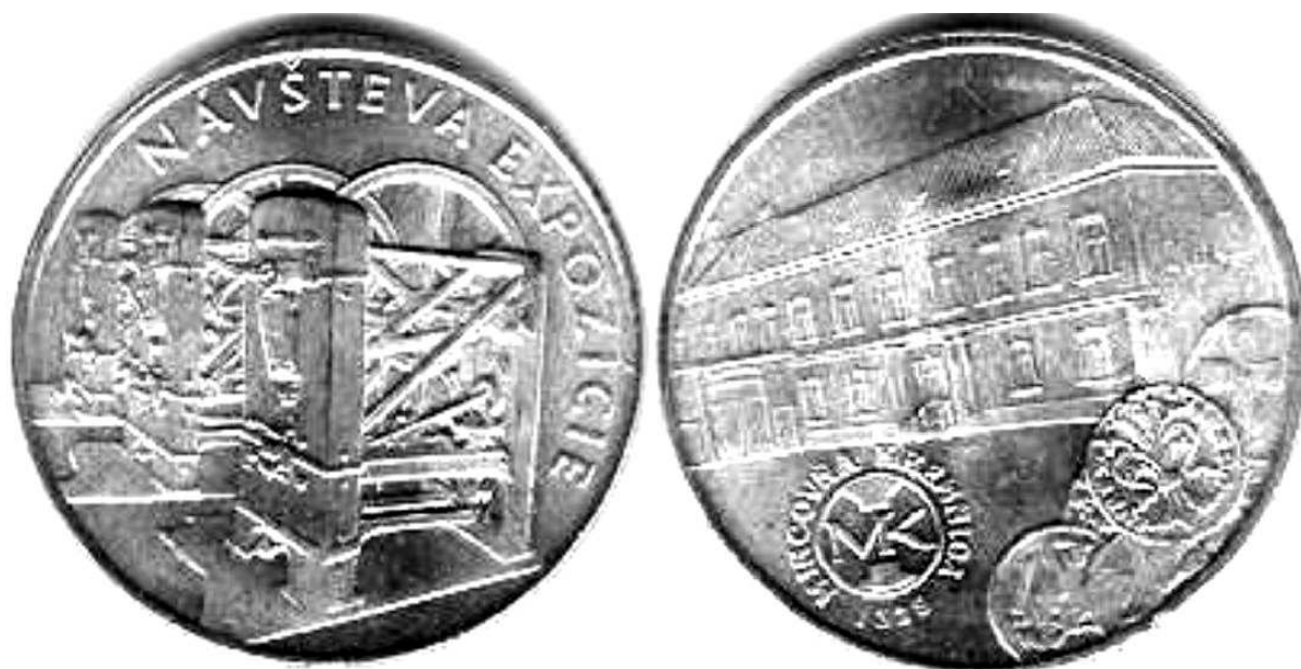
Žeton česki, bez roku, mennica w Kremnicy, miedź, 25 mm