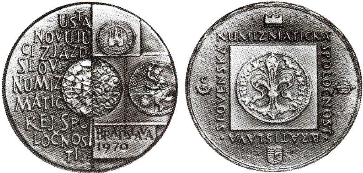
Medal z 1970 roku z okazji zjazdu powołującego Słowackie Towarzystwo Numizmatyczne w Bratysławie; brąz, 70 mm