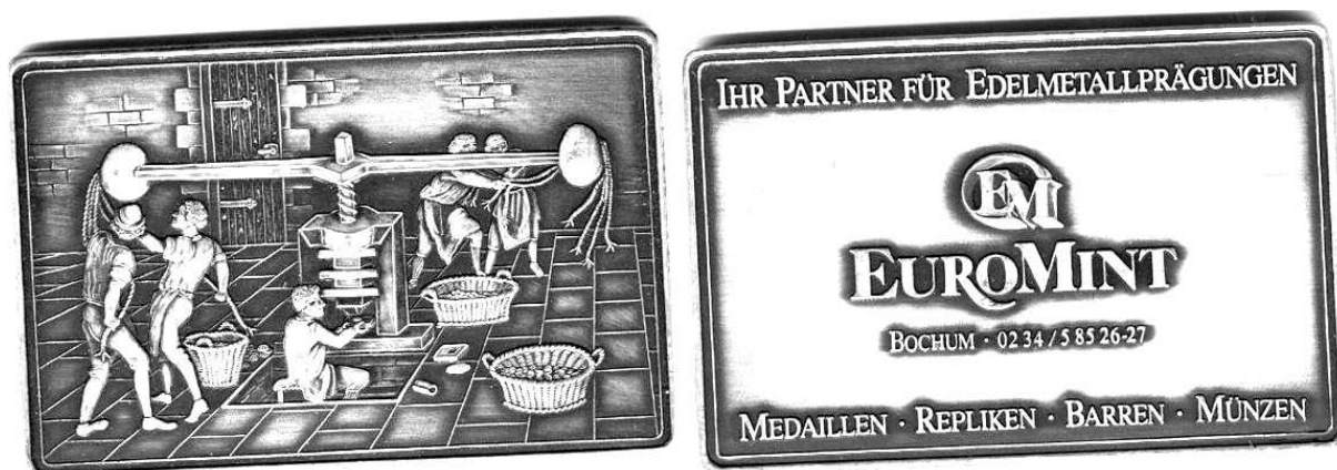
Medal – plakietka z początku lat 90, prostokąt, srebro, 51 x 76 mm