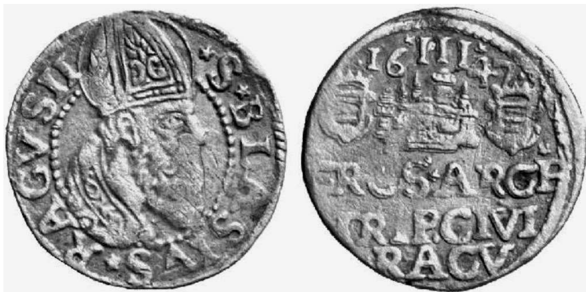
Artiluk z roku 1647 (wąska mitra)