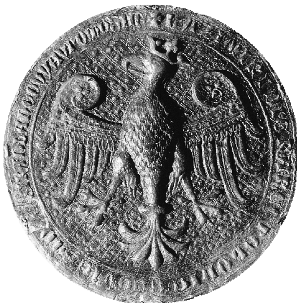
Fot. 3. Wizerunek pieczęci majestatycznej Kazimierza Wielkiego z widocznym godłem państwowym w koronie, które w niezmienionej formie Józef Gosławski przeniósł na projekt awersu monety