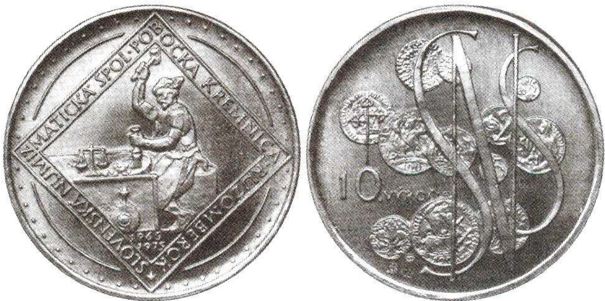
Medal z 1975 roku z okazji 10 rocznicy Oddziału Słowackiego Towarzystwa Numizmatycznego w Kremnicy-Ruzomberok; tombak patynowany, 70 mm