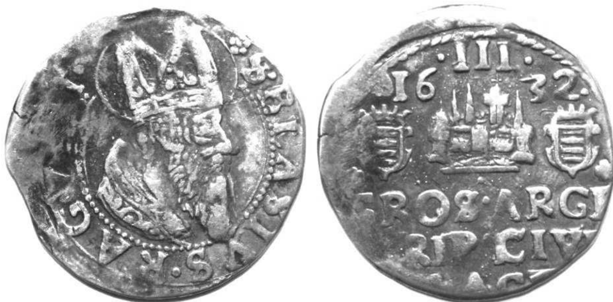
Artiluk z roku 1632, odmiana 6b