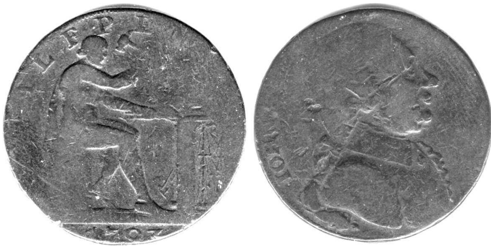
Żeton kanadyjski (?) z 1797; miedź, 28 mm