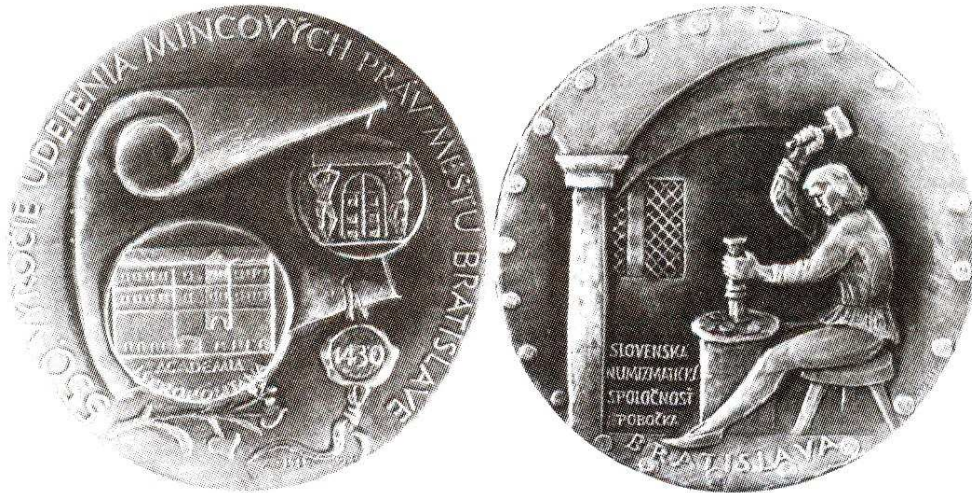
Medal z 1980 roku, wydany z okazji 550 rocznicy nadania praw menniczych miastu Bratisławie; tombak patynowany, 70 mm