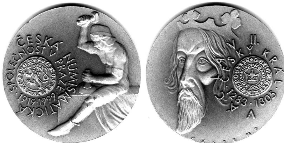
Medal z 1999 roku, wybity z okazji 80 rocznicy Czeskiego Towarzystwa Numizmatycznego Pradze; tombak srebrzony, 60 mm