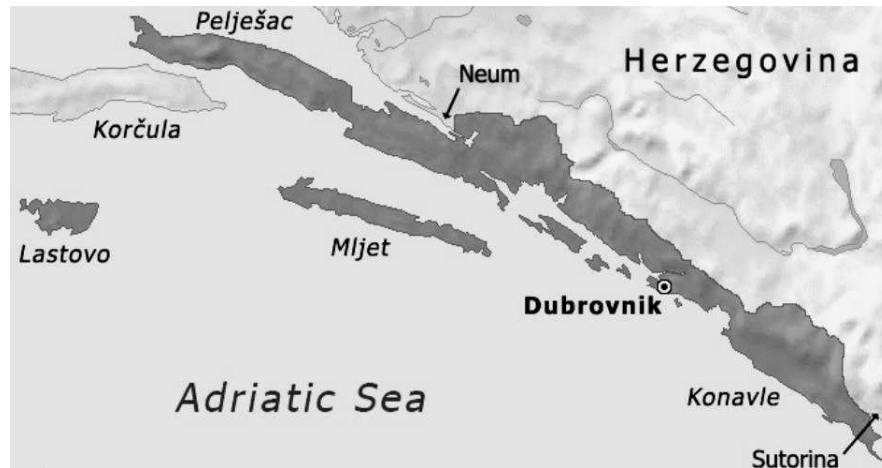
Mapa Republiki Raguzy

Republika Raguzy – republika kupiecka zajmująca obszar wokół dzisiejszego Dubrownika, istniejąca w latach 1358-1808. W swojej historii ulegała wpływom potężniejszych sąsiadów takich jak Wenecja, Węgry czy Imperium Osmańskie.