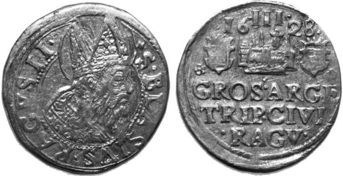
Artiluk z roku 1628 (szeroka mitra)