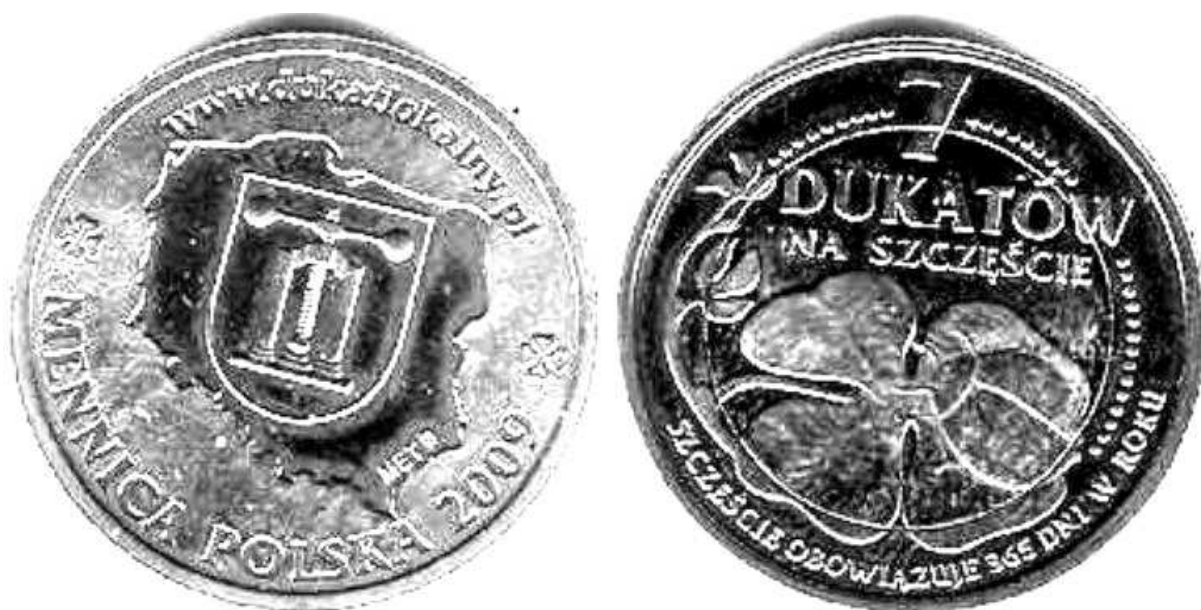
Żeton menniczy z 2009 roku; GN, 28 mm