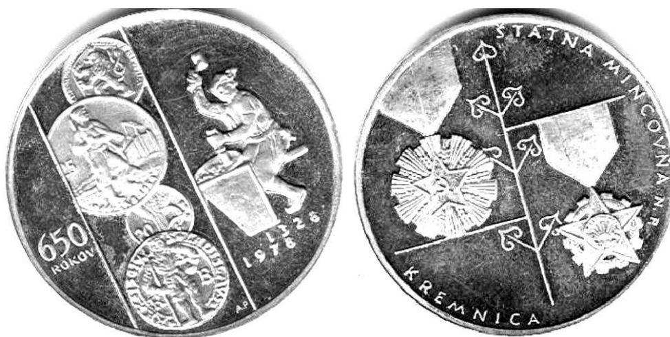
Medal z 1978 roku wybity z okazji 650 rocznicy otwarcia mennicy państwowej w Kremnicy; srebro, 42 mm