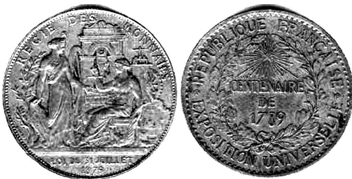
Medal z roku 1879 upamiętniający setną rocznicę wystawy powszechnej w Paryżu