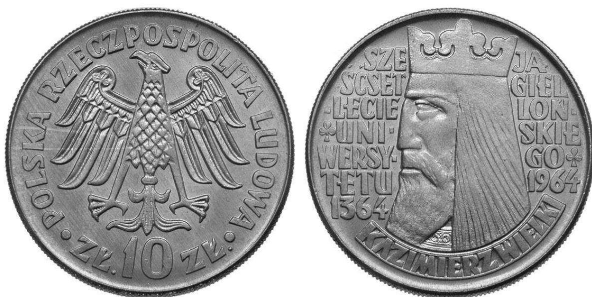
Fot. 4. Zwycięski projekt Wacława Kowalika, który wszedł do powszechnego obiegu w dwóch odmianach: z wklęsłym i wypukłym napisem na rewersie

Fotografie monet użyte w artykule (Fot. 1 i Fot. 4) pochodzą ze strony Warszawskiego Centrum Numizmatycznego www.wcn.pl . Zdjęcia modeli gipsowych (Fot. 2) zamieszczono dzięki uprzejmości rodziny Józefa Gosławskiego. Wizerunek pieczęci (Fot. 3) pochodzi z książki „Orzeł Biały – 700 lat herbu Państwa Polskiego”, Warszawa 1995.