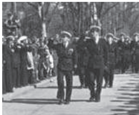
Rys. 20. Przemarsz Kompanii Akademickiej ulicami Gdańska w dniu 1 maja 1949 r. (Narcyz Klatka „Absolwenci Politechniki Gdańskiej oficerami Marynarki Wojennej”)

W roku akademickim 1948/49 została utworzona Gdańska Kompania Akademicka, podlegająca dowódcy Marynarki Wojennej. Studenci – żołnierze kwatowali w koszarach w Gdańsku-Wrzeszczu.