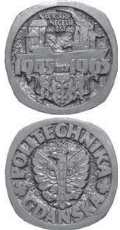
Rys. 3. Medal wybity z okazji 20-lecia Politechniki Gdańskiej (ze zbiorów autora)

Kolejne medale zostały wyemitowane w czasach Politechniki Gdańskiej, po 1945 roku. W 1965 roku został wyemitowany medal z okazji 20-lecia uczelni.