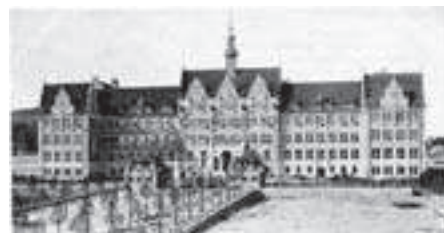
Rys. 14. Gmach Główny w 1904 roku (pocztówka ze zbiorów autora)