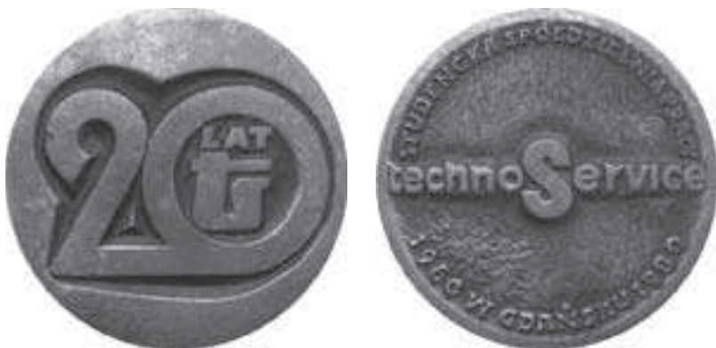
Rys. 26. Medal 20-lecia „Techo-Service”

Na rys. 26 pokazany jest medal z okazji 20-lecia SSP „Techno-Service”.