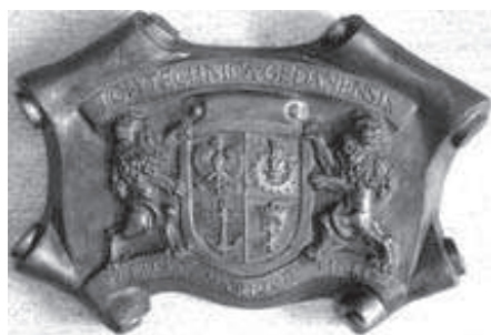
Rys. 16. Projekt herbu Politechniki Gdańskiej

Projekt herbu jest przechowywany w Pracowni Historii Politechniki Gdańskiej (rys. 16).