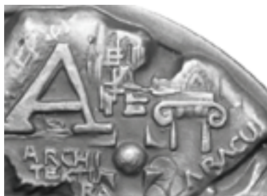
Rys. 6. Napisy i rysunki związane z architekturą

Dookoła człowieka witruiwiańskiego, na rewersie medalu znajduje się pięć wypukłych, nieregularnych plam, zawierających napisy, symbole i rysunki związane z różnymi dyscyplinami naukowymi (rys. 6 – 10).