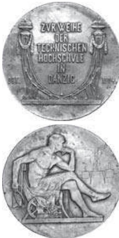
Rys. 1. Medal wybity z okazji inauguracji Technische Hochschule in Danzig (ze zb. autora)