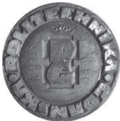
Rys. 11. Model awersu medalu (ze zbiorów Pracowni Historii PG)

W zbiorach Pracowni Historii Politechniki Gdańskiej znajduje się gliniany model awersu tego medalu (rys. 11). Średnica modelu wynosi 21 cm.