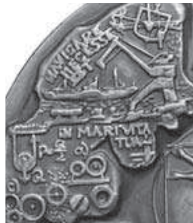
Rys. 10. Napisy i rysunki związane z mechaniką i budową okrętów