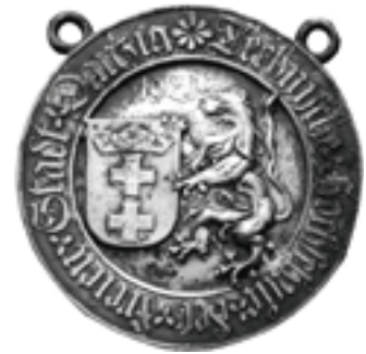
Rys. 2. Medal Technische Hochschule der Freien Stadt Danzing z 1921 roku (Gdańskie Zeszyty Numizmatyczne, nr 75/2008)

Do 1920 roku politechnika w Gdańsku podlegała władzom pruskim. Od 1920 roku uczelnia należała do Wolnego Miasta Gdańska. Z tego okresu pochodzi medal jednostronny pokazany na rys. 2.