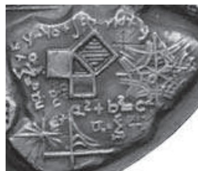
Rys. 8. Rysunki i wzory matematyczne