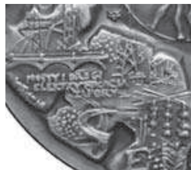
Rys. 9. Napisy i rysunki związane z inżynierią lądową i elektroenergetyką