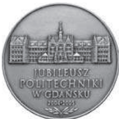
Rys. 13. Medal wybity z okazji jubileuszu w 2004 roku (ze zbiorów autora)

Drugi medal z 1973 roku ma taki sam rewers, natomiast w centrum awersu znajduje się orzeł w koronie (rys. 12). Poniżej umieszczono herb Gdańska z dwoma lwami, w zewnętrznym otoku napis POLITECHNIKA GDAŃSKA, w wewnętrznym otoku – UNIVERSITAS TECHNOLOGICA GEDANENSIS.