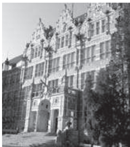
Rys. 17. Fragment elewacji frontowej Gmachu Głównego z 2010 r.

Medale Pamiątkowe Politechniki Gdańskiej otrzymują m.in. pracownicy zatrudnieni dla budowania prestiżu Uczelni.