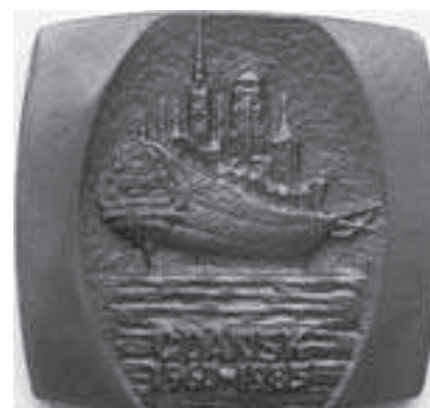
Rys. 27. Medal 25-lecia „Techo-Service”

Na awersie umieszczony jest napis „25 STUDENCKA SPÓŁDZIELNIA PRACY techno service”. Na cyfrze „5” logo spółdzielni. Na rewersie pokazany jest galeon na wodzie. Zamiast masztów budynki starego Gdańska. W dolnej części napis „GDAŃSK 1960-1985”.