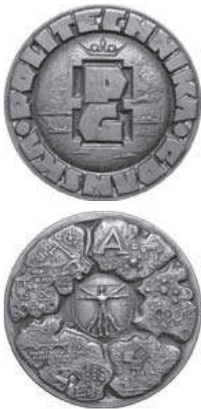
Rys. 4. Medal Politechniki Gdańskiej z 1973 roku