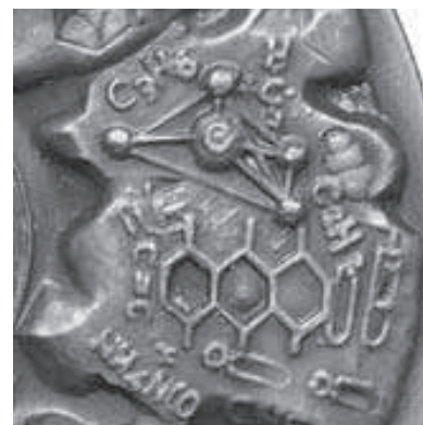
Rys. 7. Symbole chemiczne