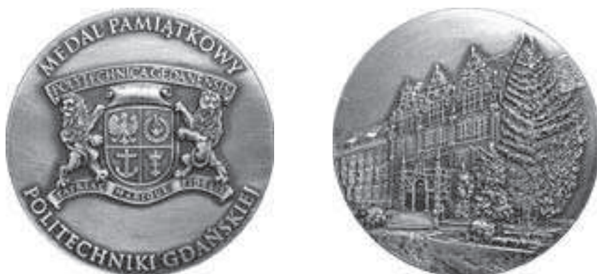
Rys. 15. Medal Pamiątkowy Politechniki Gdańskiej (ze zbiorów autora)